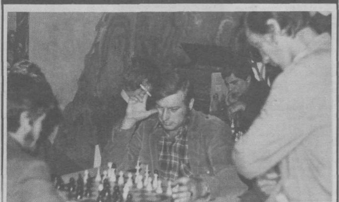
V šahovskem klubu, ki so ga mladi organizirali v okviru mladinskega aktiva Zalog, je vedno gneča. Mladi ljubitelji šaha radi sedajo za šahovnice.