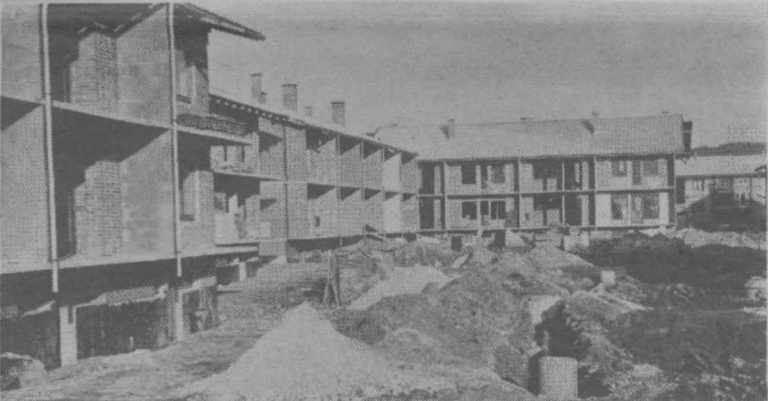
V Novem Polju intenzivno gradijo nova stanovanja.