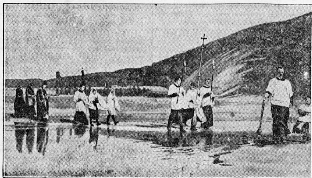
Vernih duš dan v Angliji

Od leve na desno: narodno-socialistični poslanec dr. Frick, predsednik odbora; državni kanceler dr. Brüning in minister za vnanje zadeve dr. Curtius.