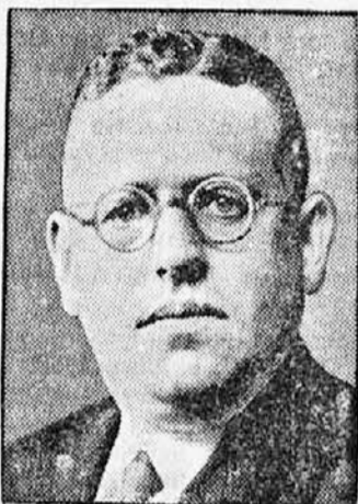
Politični spori v Nemčiji

Ko pa se je prvi vihar razburjenja poleg, so se člani akademije začeli zopet shajati, Galileo Galilei pa jih je poučeval v naravoslovju. Pri pouku pa sta bila merodajna dva instrumenta: teleskop (daljnogled) in mikroskop (drobnogled). Od te dobe dalje pa se je naravoslovje vedno bolj razvijalo do današnje višine.