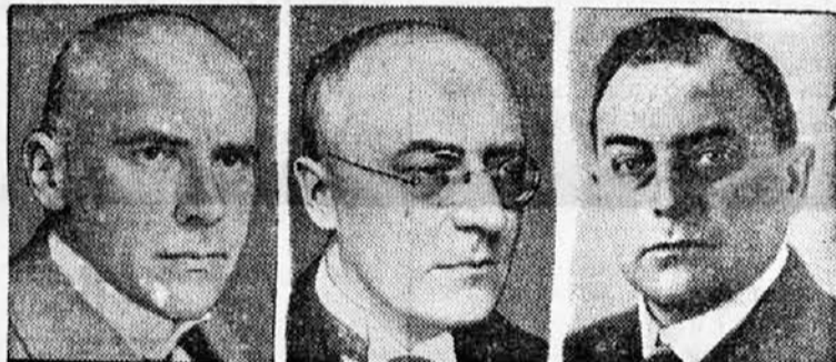
Odbor nemškega parlamenta za vnanje-politične zadeve.