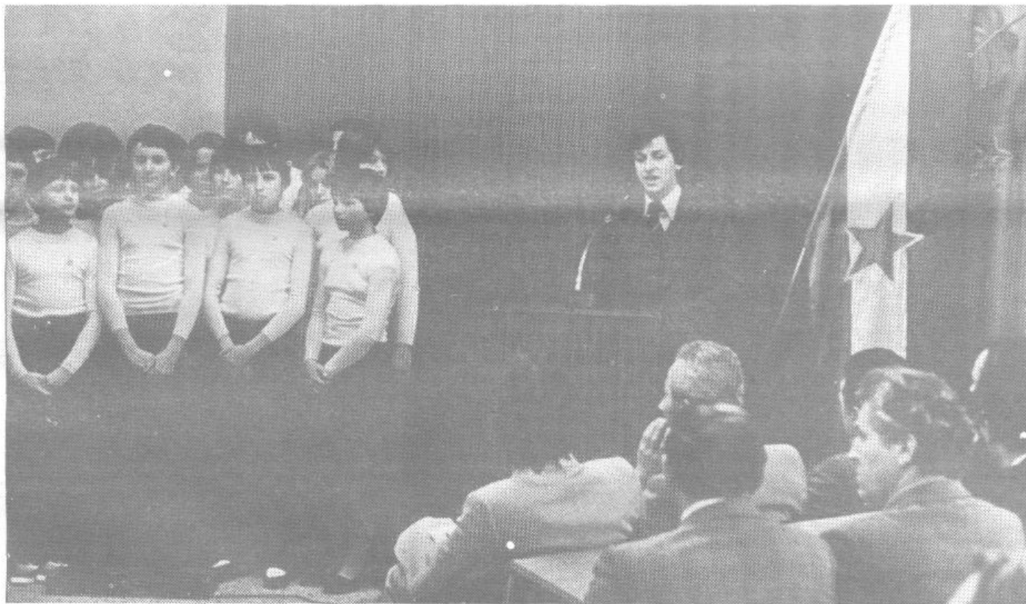
Slovesna je bila proslava dneva JLA v naši občini (več o tem na 2.strani)

Številna prizadevanja samih krajanov so bila tako v zadnjem času usmerjena v razreševanje perečih življenjskih vprašanj kot so začetek izgradnje TPC in pa seveda nove osnovne šole ter VVZ. To pa so le najpomembnejše aktivnosti teh krajanov in družbenopolitičnih organizacij, ki tudi sicer dosledno prispevajo k razvoju naše občine in tudi širše družbene skupnosti.