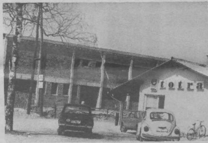
Dograditev obrata pozamentarije v Totri bo omogočila za 20 % večjo proizvodnjo in boljše delovne pogoje

Za reševanje perečega problema preskrbe občanov je pomembna izgradnja večjih trgovskih objektov v novih stanovanjskih soseskah: v Štepanjskem naselju gradi NAMA samopostrežno trgovino s 1200 kv. m poslovne površine. Za gradnjo potrošniškega centra (2500 kv. m poslovnih površin) s samopostrežno trgovino in objektom družbene prehrane v Štepanjskem naselju ter za gradnjo samopostrežne trgovine v Zalogu (600 kv. m prodajnega prostora) je Ljubljanska banka vloga za kredite že predložila v