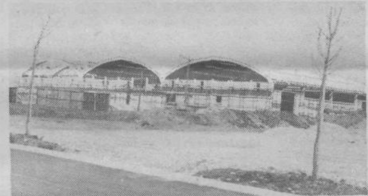
Plutal je ob novi tovarni avtoopreme v Industrijski coni najdlje za gradnjo

predvidena pa je tudi gradnja tovarne koles „Rog“.