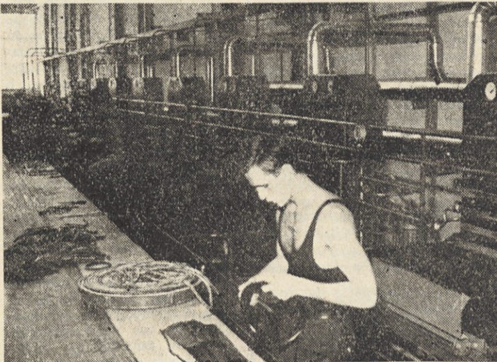
Vulkanizacija tehničnih izdelkov v TH

Za našo panogo so se ob zadnji sprostitvi v juniju sprostile cene za gumirano