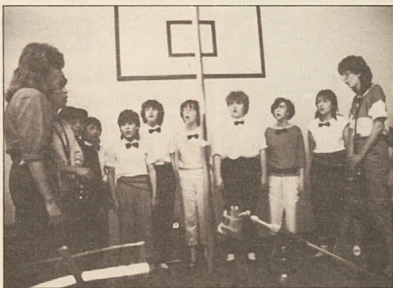
Rožeški mladinski zbor prinesel pozdrave Koroške.