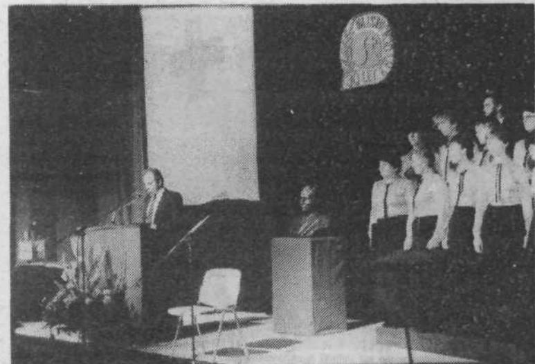
Slavnostna proslava ob obletnici krvodajalstva v domu Ivana Cankarja