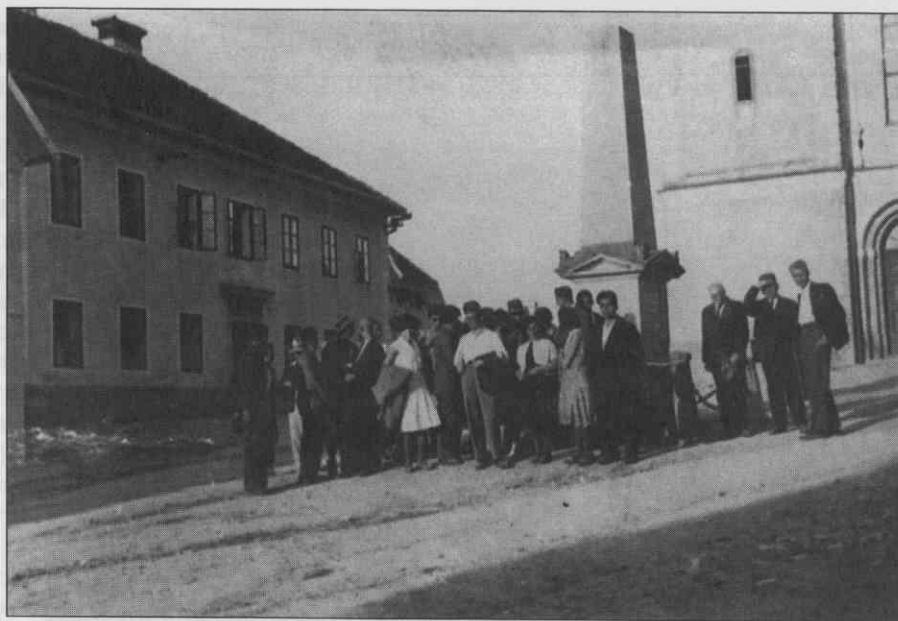
Izlet slušateljjev Juridične fakultete - Velike Lašče.