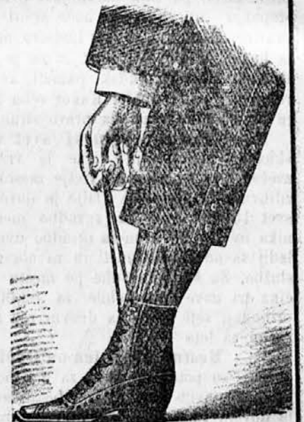
Z enim potegljajem zaprto.