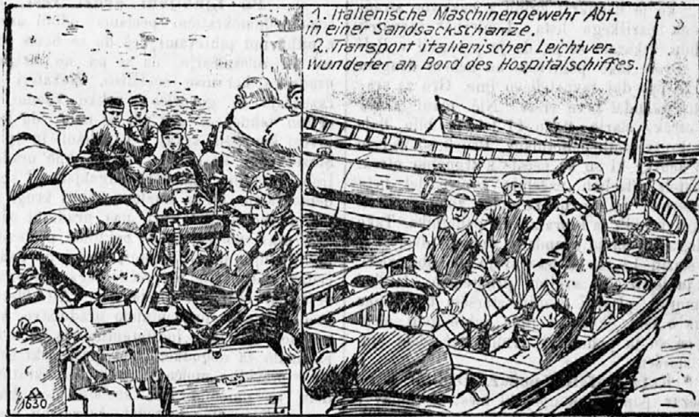
1. Italienische Maschinengewehr Abt. in einer Sandsackschanze. 2. Transport italienischer Leichtverwunderer an Bord des Hospitalschiffes.

Referent je poročal v zmislu rešitve, s katero je bila deželna vlada kranjska odklonila