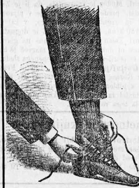
Z enim potegljajem odprto.

Dalje imam vedno v zalogi veliko izbiro raznovrstnega usnja in podplatov. vse čevljarske potrebščine in najboljših gumi-podpetnikov „Berson“ (trgovcem dajem popust) Na vsestransko zahtevo sem s 1. novembrom vpeljal lastno izdelovanje gornjih delov za vsa obuvala. Naročila se točno in solidno izvršujejo.