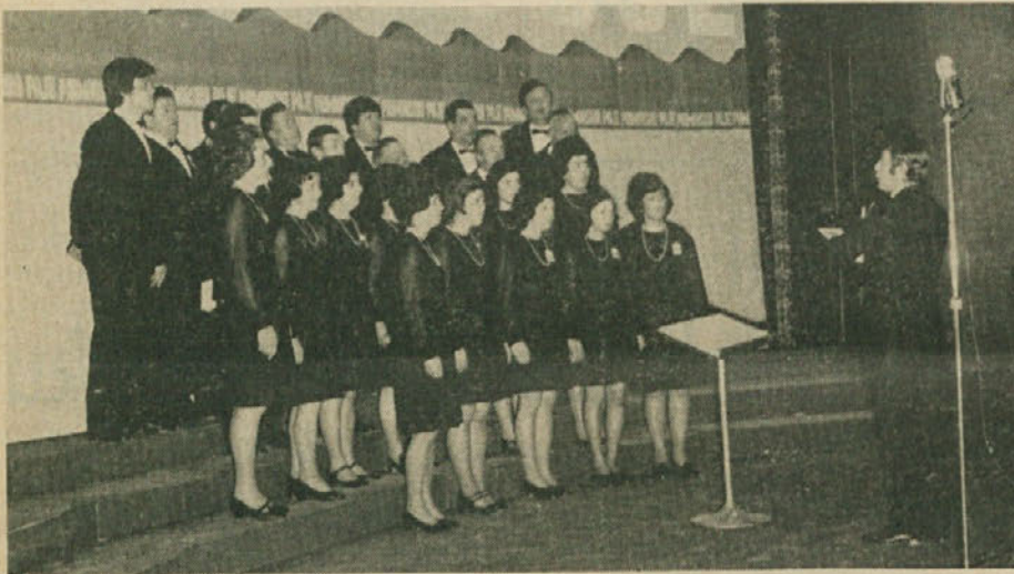
Pevski zbor prosvetnega društva Primorec iz Trebč.

Trebenci, ki so se na slavje skrbno pripravili, pričakujejo, da jih bodo v soboto in nedeljo obiskali tudi številni prijatelji iz sosednjih vasi in iz mesta.