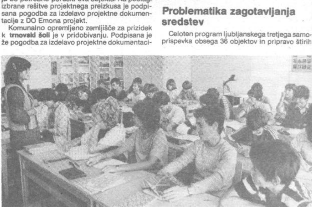
Iz OŠ Krim-Rudnik

Do decembra 1982 je bilo na območju občine izmed 13 objektov dokončanih deset objektov, dva sta v gradnji in eden v pripravi. Tako je bil na