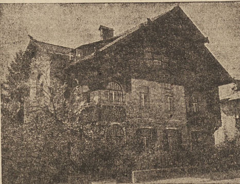
V tej hiši je bila pred 13. leti ustanovljena OF.

Zato se bomo na ta dan spominjali vseh tistih slavnih podvigov, ki jih je naše delovno ljudstvo doseglo v času osvobodilne vojne. Še posebno se bodo spominjali prebivalci naših gorskih vasi, kjer so se ravno v tem času pred 13 leti