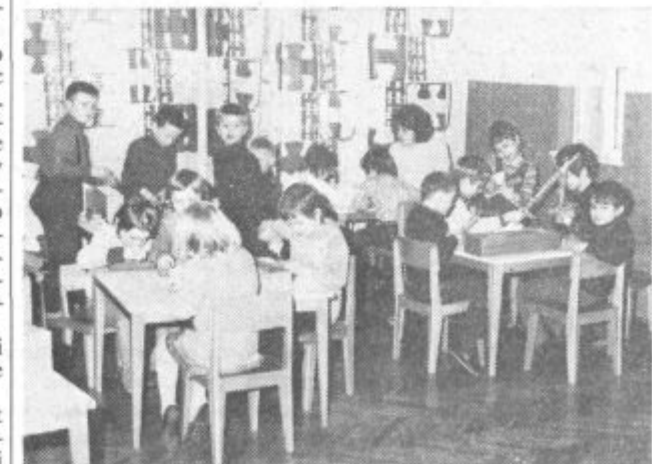
V novih prostorih

Vrtec imajo razdeljen v tri oddelke: za najstarejše, srednje in najmlajše otro-