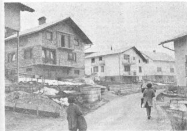
Tu na Graškogorski cesti so družinske hišice, katere bi lahko mirno imenovali »mali penzionci«. V posameznih prebiva do deset podnajemnikov

Pritisk nove delovne sile, ki jo je gospodarstvo doline sprejelo z odprtimi rokami, je obvisel ob problemu stanovanj. Medtem, ko so se službe in to tiste z lepimi dohodki ponujale, ni prostora za bivanje. Znana ekonomska resnica je, da cene odražajo ponud-