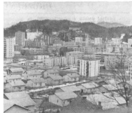
Stanovanj v Velenju ni šla v korak z razvojem zato manjka predvsem stanovanj za mlade ljudi brez družin

vidoma moč na iti 560 stanovanj jih v Velenju priokrog 1000, do pa bi jih potrebo- Po naših izračun- pospešenim tem- nje do 1976. leta odpravili. Pri- je nastal ob ve- oku delovne sile v Gorenju. Ta »a je začel z di- radnjo stanovanj ij leti. Trenutno elitvijo njihov 183- ski blok, letos pa eli še z gradnjo stanovanjskih ob-