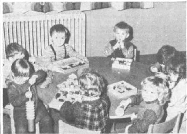
Najmlajši pri igri

Poslovala sem se od upravnice, vzgojiteljic in seveda tudi od otrok, prepričana, da bodo starši in vzgojiteljice tudi vnaprej v tako dobrih odnosih in da bodo otroci vedno v skrbnih rokah in se v svojem obnovljenem vrtcu prijetno počutili. Saj to je njihov drugi dom. H. Vrhovšek