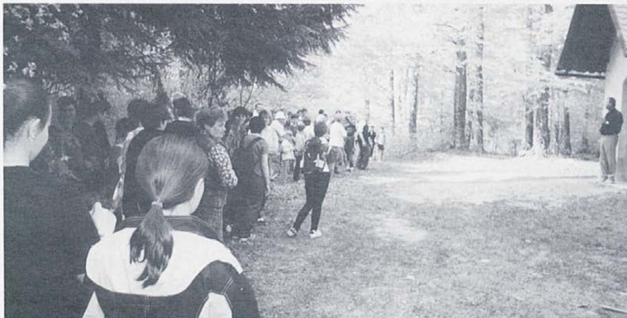
Velikonočna nedelja 2000

To se še posebno pozna v zadnjem času, ko je sin Sandi postal krovec in je kapelica dobila novo streho in fasado in je postala še prijaznejša postaja za pohodnike, kolesarje in traktorje, ki so nadomestili konjske vprege.