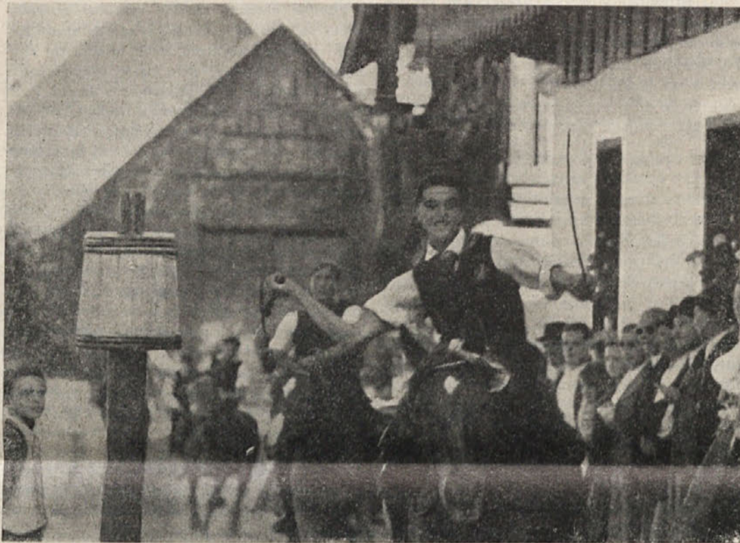
Zdaj zdaj bo padlo po bariglici... (Š štehvanja pred nekaj leti v Gorjah)

Sledila je ljudska zabava v bližnji gostilni. Godli so godci, ki se sami imenujejo »veseli planšarji«, ki so pa nekam hudo gledali, pogosto počivali in razlagali v tako zvanem programu lanske »smešnice«.