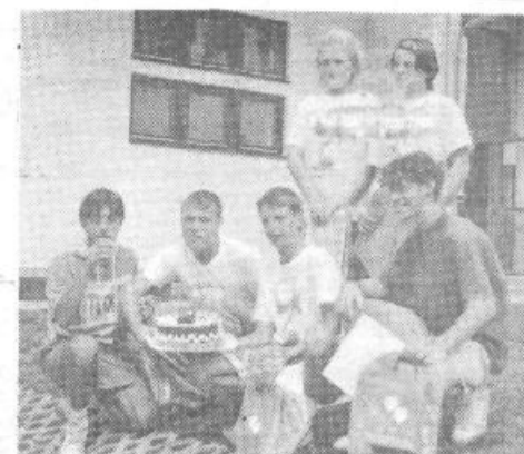
Zmagovita ekipa udeležencev športnih iger zdravega diha.