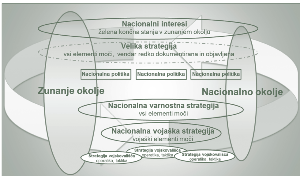
Slika 2: Medsebojni odnosi in hierarhija strategij (Vir: Yarger, 2006: 9)

Raven in vrste strategij obsegajo različna področja družbenega življenja, s čimer se zagotavljata hierarhičnost in celovitost. Tako se pri oblikovanju strategije proučijo notranji in zunanji dejavniki na vseh ravneh ter horizontalna in vertikalna integracija strategije. Strateg mora torej razmišljati celovito in tudi celovito poznati okoliščine in dogajanja v strateškem okolju, da lahko objektivno oceni situacijo ter prednostno razvrsti izbire glede na učinke, ne glede na to, ali so pri tem akterji prijateljski, sovražni ali neopredeljeni. Strateg mora poznati tako celoto kot tudi notranje