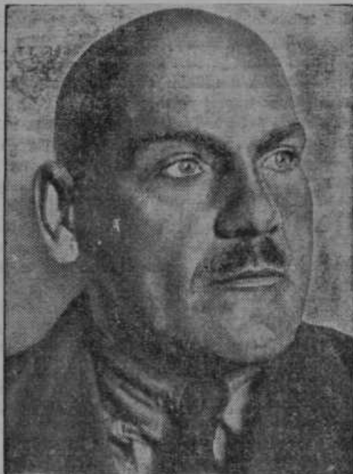
Krilenko, letos januarja odstavljeni komisar za pravosodje in večletni Stalinov krvnik, bo v Moskvi v kratkem obsojen kot izdajalec na smrt in bo ustreljen.

šele za leto 1939. Za letošnje leto pa je bilo v okrožnicah že povedano, da morajo biti vsi redni občni zbori izpeljani do konca meseca aprila. Edinice pa dan svojega občnega zbora dočijo same in o tem glavni odbor samo obvestijo. Prosimo, da se tega termina točno držite in da čimprej pošljete poročilo. Glede predavateljev je bilo tudi že rečeno, da bo glavni odbor poskrbel za predavatelje samo pri onih edinicah, ki potrebujejo pozitivne, vse ostale edince pa naj skrbijo, da dobijo predavatelje iz svoje okolice.