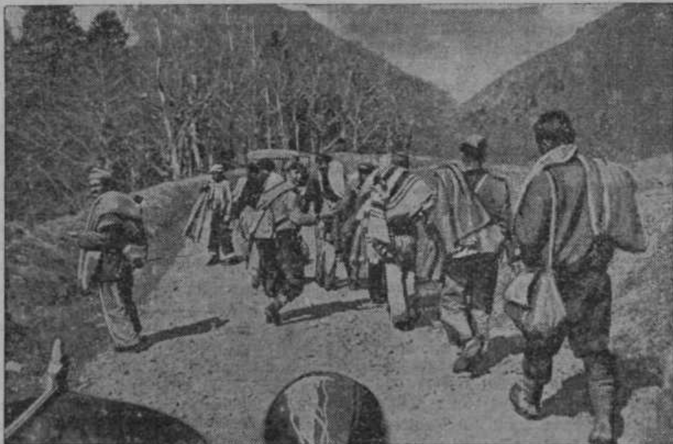
Rdeči miličniki na pobegu iz Španije v Francijo.