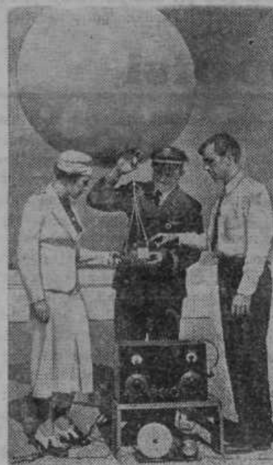
V Burbanku v Kaliforniji spuščajo v zračne visine male balone z radio-oddajnimi aparati. Iz višin poslani radio-signali omogočajo vremenoslovem sigurno vremensko napoved za deset dni.

Česa ni bilo še nikdar na svetu? — Svetovnega miru.