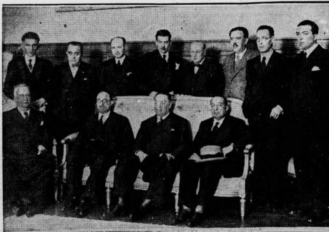
ki jo je sestavil Martinez Barrios, ima v kabinetu večino članov bivše vlade Lerrouxa