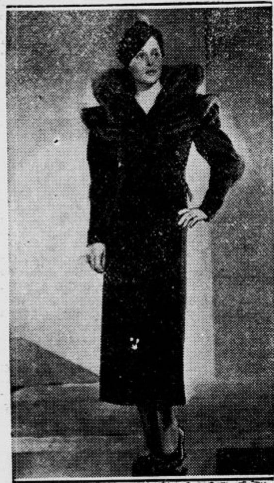
Letošnja modna barva je rjava, poudarek plašča pa je v ovratniku iz kozuhovine