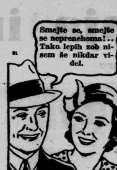
Smejte se, smejte se neprenehoma... Tako lepih zob nisem še nikdar videl.