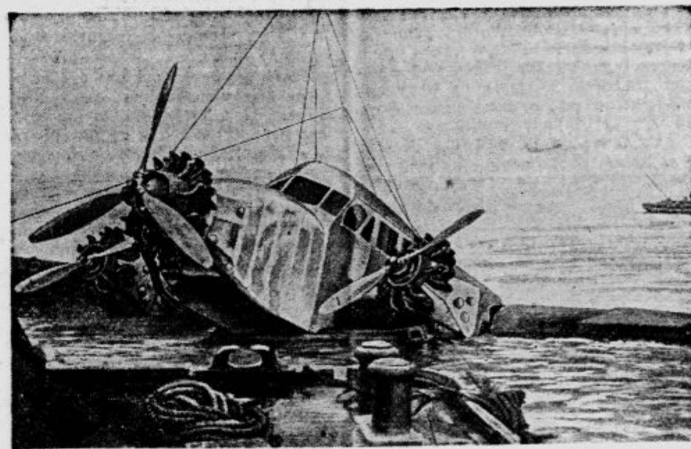
Novi francoski hidroplan, največje tovornostno letalo francoske mornarice, je padlo na poskusnem poletu v bližini reke Loire na tla in se poškodovalo