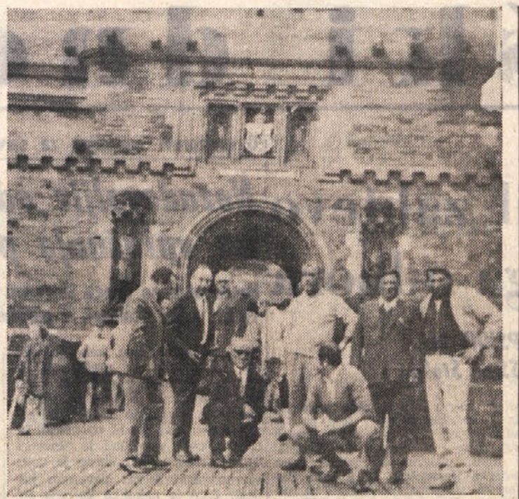
Na sliki skupina izletnikov s Proseka - Kontoveca, ki so se skupno z zborom «Vasilij Mirks» in športnim društvom «Primorje» odpravili na izlet v Edinburgu, kjer je vsako leto tradicionalni mednarodni festival. Pri vseh udeležencih gostovanja je še vedno živ spomin na bivanje v gostoljubnih mestih Airidre in mnogi se navdušujejo nad zamisljivo, naj bi ti stiki postali tradicionalni. Vsem tistim, ki so s svojimi prispevki omogočili odhod na škotsko, se bo zbor «Vasilij Mirks» odzidal v javnim koncertom, ki ga bo priredil v soboto zvečer v Kraski hiši v Velikem Repu. Na ta koncert, s katerim bo ob enem zaključil svojo uspešno sezono, vabi zbor vse svoje prijatelje in ljubitelje lepe pesmi.

Oče se nato v pismu znova dotika zbirane akcije za spomenik Palachu in se vprašuje, kako je mogoče, da se podobne akcije tako organizirajo v šolah. Kako telega dovoljujejo za šolstvo kaj telega dovoljujejo ali pa se to morda dogaja na osnovi kakšne pretvarne pobude? Iz šol nenehno prihajajo prizočbe, da so pe-