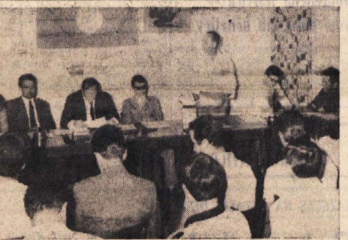
Se dve sliki z zadnjega občnega zbora SD Breg: delovno predsedstvo (zgoraj) in pogled na dvorano (spodaj)