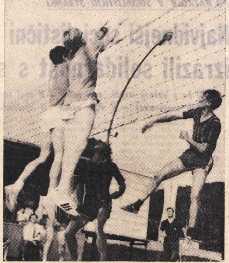
Sezona raznih odbojarskih prvenstev se je končala in začelo se je obdobje raznih turnirjev. Prvega so pred časom organizirali v Zgornji (na sliki: Kras-Kanal), v kratkem pa bodo na vrsti še na Opčinah, v Bazovici, Nabrežini in drugod