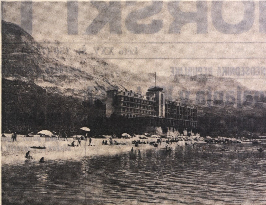
Jugoslovanski tujski turizem nenehno raste. Lani je obiskalo sosedno državo več kot 4 milijone tujcev. Na sliki: dalmatinska plaža Tučepi pri Makarski

VATIKAN, 9. — Papež Pavel VI. bo jutri odpotoval v svojo poletno rezidenco v Castelgandolfo, kjer bo ostal do 31. julija. Potem bo Pavel VI. odšel v Afriko.