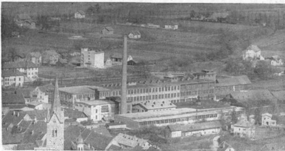
Slov. Konjice — v ospredju usnjarski kombinat Konus z novozgrajenim obratom za umetno usnje