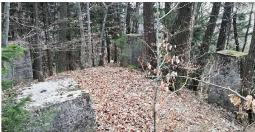
Slika 13: Betonski ostanki stražnega stolpa na Grabcih.

Na zelo kratki razdalji je na hribu Grabci stal naslednji stražni stolp. Tu so prav tako še vedno ohranjeni betonski podstavki stražnega stolpa, nahajajo se približno 200 metrov od gostilne Podobnik. Sklepamo, da je bil še manjši, saj razdalja med podstavki meri manj kot 6 metrov.