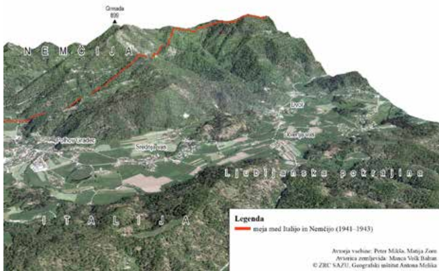
Slika 2: Potek nemško-italijanske meje preko Polhograjskega hribovja.

Za določitev nemško-italijanske meje je bila vzpostavljena skupna razmejitvena skupina, ki so jo sestavljali italijanski vojaki in nemški uradniki. Delovala je v prvih mesecih po okupaciji. Nova italijansko-nemška državna meja je bila hkrati meja Ljubljanske pokrajine in v tem delu tudi najbolj nesmiselna, saj je Ljubljano odrezala od zaledja na severu. Šlo je za posebej nenaravno mejo, ki je sledila zgolj strateškemu namenu. 15