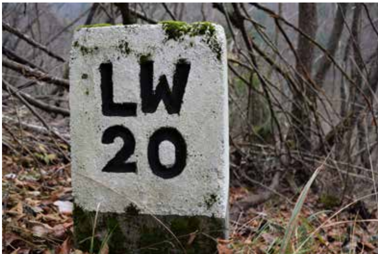
Slika 5: Mejni kamen LW 20 nad Kovčkom.

Na drugi strani reke Božne na pobočju nad Kovčkom leži mejni kamen z oznako LW 20. Kamen se nahaja nad kmetijo pri Kovčk, približno 60 metrov pod cesto na Setnico. Kamen je obnovil Milan Košir.