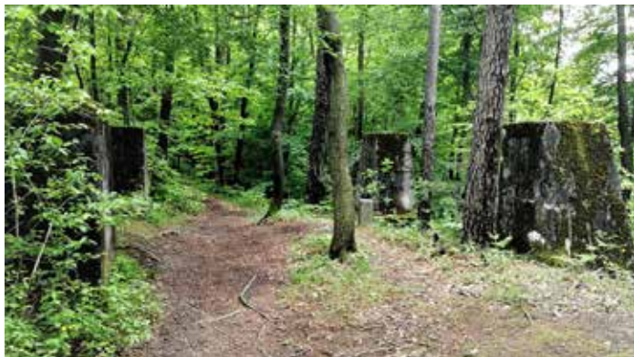
Slika 14: Betonski ostanki stražnega stolpa na Toškem Čelu.

Stražnemu stolpu na Grabcih je sledil stražni stolp na Toškem Čelu (535 m n. v.). 41 Postavljen je bil na strateško pomembni točki, od koder se spustimo proti Šentvidu pri Ljubljani. Zunanji tloris betonskih podstavkov meri 7,5 x 7,5 metra. Na podlagi tlorisa lahko predvidevamo, da je bil po dimenzijah večji od predhodnih dveh. Na enem izmed betonskih podstavkov je pritrjena spominska tabla, ki nas opominja na nekdanjo mejo.