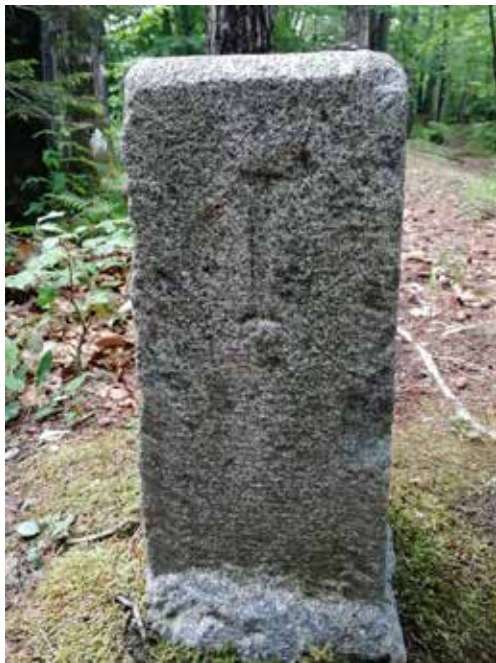
Slika 6: Mejni kamen na Toškem Čelu, ki označuje italijansko okupacijsko cono.