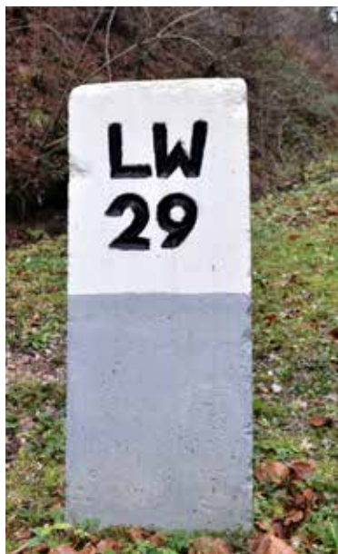
Slika 3: Mejni kamen LW 29 v Medvedovem malnu.