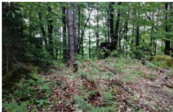
Slika 15: Ostanki betonskih podstavkov pri Črnem Vrhju.

Stražnemu stolpu na Toškem Čelu je sledil stražni stolp pri Črnem Vrhju (481 m n. v.), ki je stal precej nižje. Betonski ostanki stojijo na grebenu, njihov zunanji tloris meri 7,5 x 7,5 metra in je bil podobne velikosti kot predhodni stražni stolp na Toškem Čelu.