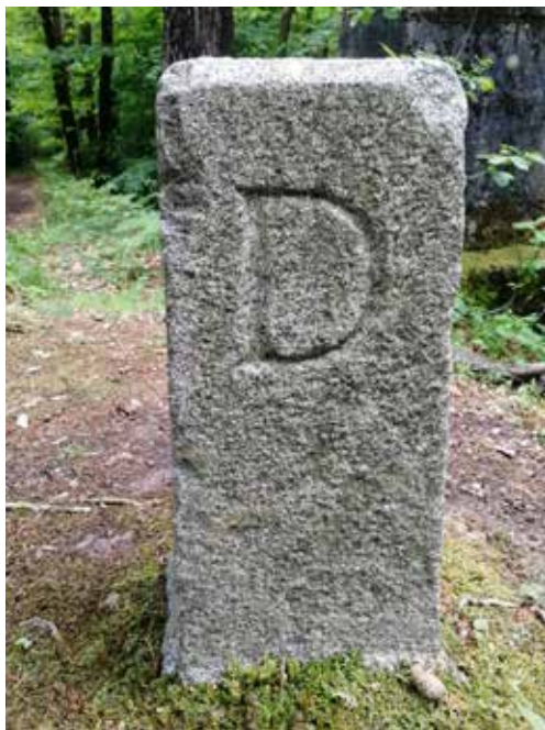
Slika 7 : Mejni kamen na Toškem Čelu, ki označuje nemško okupacijsko cono.