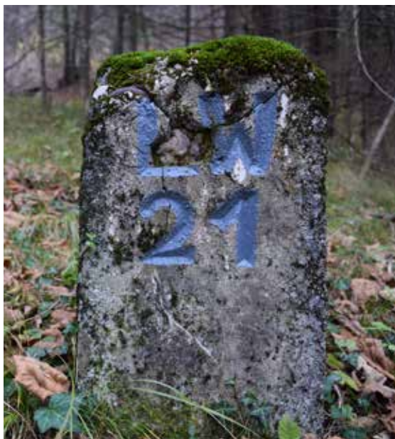
Slika 4: Mejni kamen LW 21 v pobočju Polhograjske gore.