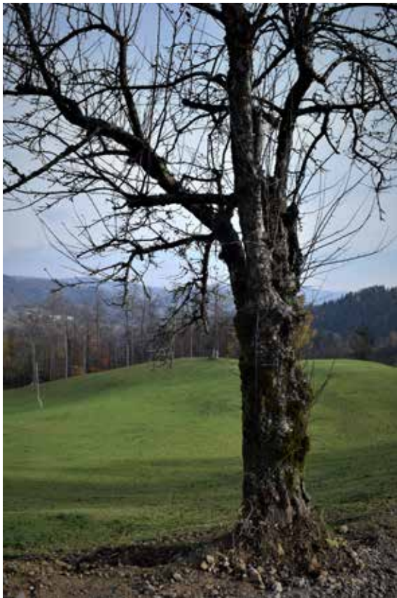
Slika 11: Jablana – gambovc, ki je služil kot kol za postavitve meje.

Zanimivo je, da sta omenjena stražna stolpa stala na zelo kratki zračni razdalji. To lahko razložimo, če na omenjeno območje gledamo kot na pomembno strateško točko. Suhi Dol je namreč predstavljal točko, kjer je potekala meja med Notranjsko in Gorenjsko. Stražna stolpa sta torej varovala pomemben prehod iz Ljubljanske kotline proti Gorenji vasi in dalje proti Primorski.