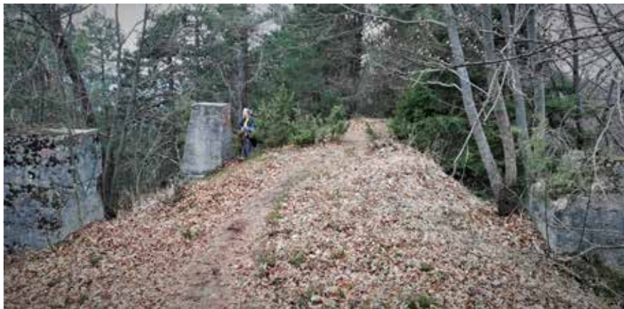
Slika 12: Betonski ostanki stražnega stolpa na Goljeku.

med podstavki na Kovčku, lahko sklepamo, da je bil stolp visok okrog 20 metrov.