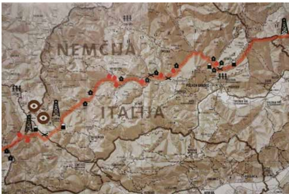
Slika 17: Zemljevid meje med Italijo in Nemčijo na območju današnje Občine Dobrova - Polhov Gradec z vrisanimi stražnimi stolpi, porušeni stavbami, lokacijami žrtev min na meji idr. 42

Na omenjenem odseku meje je bilo podrtih kar nekaj zgradb, zaenkrat nam je znanih 11 porušenih objektov. Na spodnjem zemljevidu hišice prikazujejo mesta, na katerih so bile zaradi meje porušene ali požgane domačije. Od leve proti desni si sledijo: pri Součk, pri Glavtar, Malovrh nad Roženijo, Medvedov mlin, v Trnavc, v Nart, pri Štefan, Zalaznikova bajta, Urhovc, Grajska koča in pri Kovčk. Prav tako so na sliki označena mesta, kjer stojijo stražni stolpi, mejni kamni, cestne zapore, postojanke in kje so bile žrtve zaradi meje, a le za območje Občine Dobrova - Polhov Gradec.