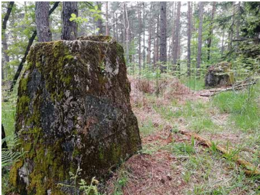
Slika 16: Ostanki betonskih podstavkov nad Pržanom.

grebenu nad Pržanom. Ohranjena sta dva betonska podstavka, ki sta vidna na spodnji fotografiji. Betonska podstavka sta drug od drugega oddaljena 10 metrov in je bil verjetno najvišji stražni stolp, katerega ostanke smo odkrili. Po dimenzijah se lahko primerja s stražnim stolpom, ki je stal v Suhem Dolu.