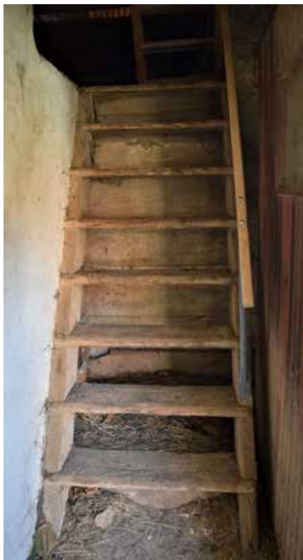
Slika 10: Ostanek dela stopnic iz stražnega stolpa v Suhem Dolu, sedaj last Koširjeve zbirke.

bivalnga prostora. /.../ So bli te graničarji uglavnm Slovenci – Korošci. So znal slovensk govort, s komandirjem vred. 38