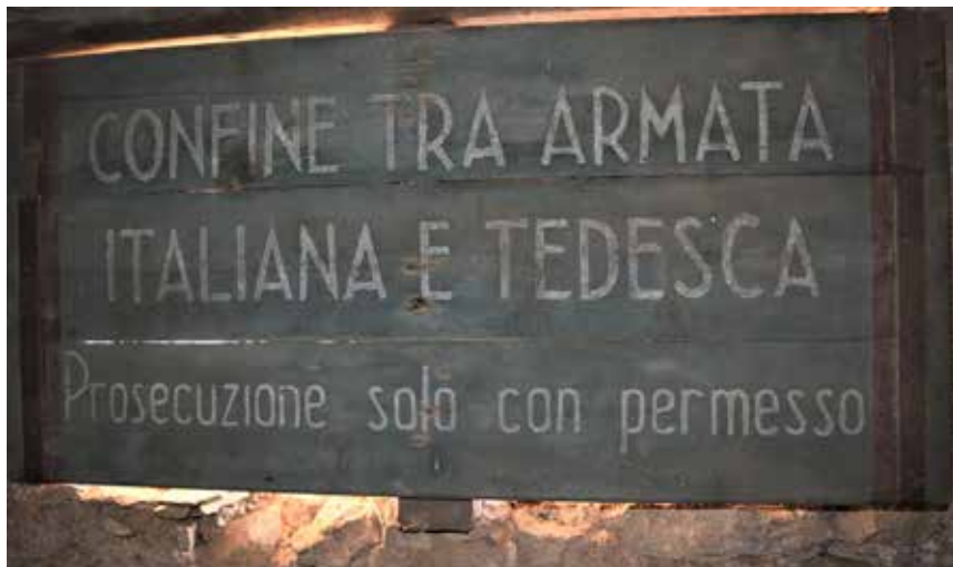
Slika 8: Italijanska mejna tabla na domačiji pri Jernejovc.