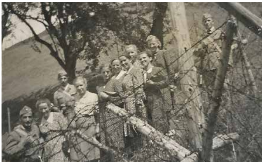
Slika 18: Z žico zavarovana meja med Nemčijo in Italijo.

živelo znotraj obrambnega pasu, se je moralo izseliti. Pri tem ni bilo pomembno, ali je šlo za Nemce ali Slovence. Nemške oblasti so vsem izseljencem zagotavljale ohranitev lastnega premoženja in pridobitev enakovredne posesti na kraju naselitve. V primeru, da izseljenih ljudi ne bi bilo mogoče naseliti na Gorenjskem, bodo poslani nekam v Tretji rajh, kjer so jim oblasti zagotavljale nemoten obstoj. 43 Mejo so po določbi nemške oblasti iz 20. januarja 1942 smeli ljudje prestopati samo z uradnim dovoljenjem oz. z veljavno obmejno listino na uradno določenih in nadzorovanih mejnih prehodih. Če je kdo mejo prestopal brez veljavnih dokumentov oz. nelegalno, je dobila nemška policija ukaz za takojšnjo uporabo orožja. Kraji, kjer so ljudje lahko uradno prehajali mejo, so bili: Rateče, Bohinjska Bistrica, Žiri, Šentvid, Črna vas in Sveti Jakob v Lazah. 44