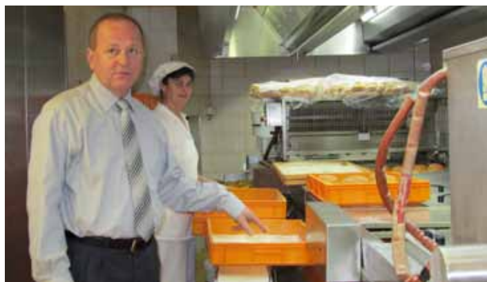
Direktor vsak dan obišče zaposlene na njihovih delovnih mestih

Gospodarstvo je resna dejavnost in v njej ni obljub, ki se jih ne da realizirati. Vsako besedo ki jo izrečeš, je potrebno skrbno pretehtati in izpeljati. Verodostojnost do sodelavcev kaj hitro izgubiš, če od danih obljub ostane le praznina. Spodbujanje – obljuba – rezultat, to je včasih zelo tanek prag, kjer mora biti človek na vodilnem položaju še bolj previden, kako bo motiviral in pozitivno deloval na sodelavce. V času, ki ga zdaj živimo, so ljudje zelo podvrženi apatijam, negativizmu in slabim klimam, zato je potrebno in moramo vložiti še več energije, da te lastnosti ne preidejo v navado, še več, vseskozi je treba poudarjati napredek in iskati dobre rešitve ter jih polagati v okolje. Brez tega pozitivnega naboja ne more ne naše podjetje ne druga podjetja ambiciozno poslovati, razne objektivne ali subjektivne okoliščine pa so največja nevarnost za slabo. Tudi v našem podjetju smo imeli v preteklosti veliko izzivov, kako uspešno preživeti, naj bo od denacionalizacije, prestrukturiranja, do odprtja