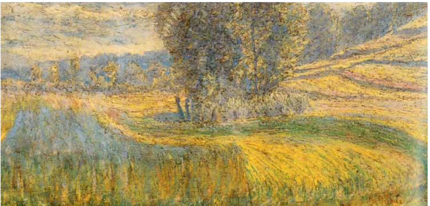
Rafolško polje, 1903, Ivan Grohar, olje na platno