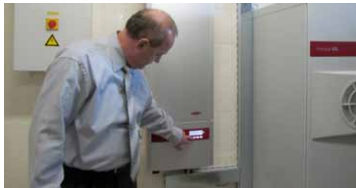
Direktor stoji pred razsmernikom električne energije

V ta namen so v preteklem letu postavili sončno elektrarno moči 49,82 kilovatov ter sproizvodnjo oziroma kogeneracijo električne toplotne energije. Poenostavljeno in razumljivo povedano: zamenjali so vse fosilne toplotne agregate, izrabljajo sončno in zeleno energijo. Energije proizvedejo skoraj toliko kot jo porabijo, država pa jim za podporo daje trikratno ceno kilovatne ure, kar predstavlja ekonomičnost investicije. Za to so v lanskem letu investirali več kot 400 tisoč evrov lastnih sredstev in upravičeno pričakujejo, da bodo investicijo obrnili v manj kot osmih letih. Tako se Gostinsko podjetje Trojane pojavlja tudi kot dobavitelj električne energije, kar še bolj plemeniti njihove rezultate podjetja.