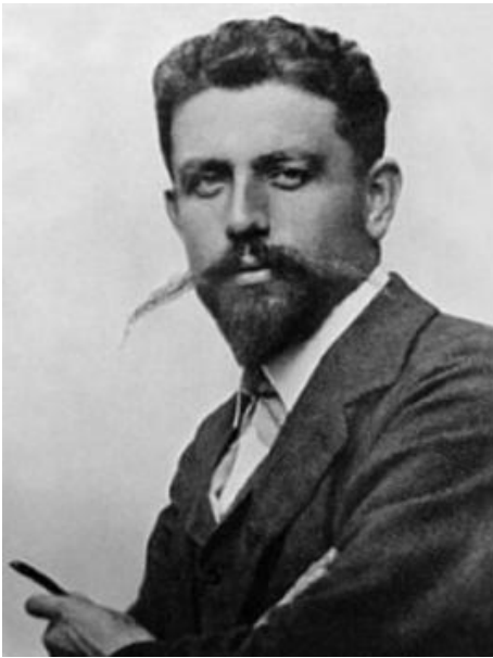
Slikar Ivan Grohar 1867-1911

Na tem svetu so stvari, dela in osebe, ki so bile in so, na katere smo lahko upravičeno ponosni. Za marsikaj ali marsikoga v hitrosti časa, ki polzi mimo nas, niti ne vemo, na marsikaj nismo pozorni, smo morda spregledali ali pa nam ni poznano. Zato želim predstaviti kaj od tega, na kar smo kot prebivalci teh krajev lahko ponosni.