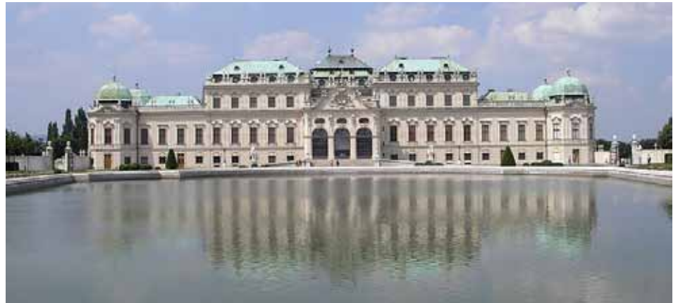
Dunaj, Oesterreichische Galerie, Zgornji Belvedere