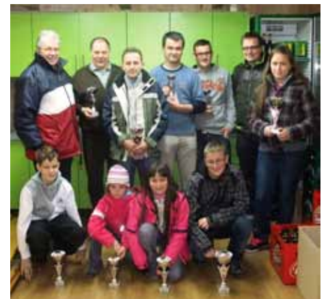
Udeleženci šahovskega tekmovanja ŠTD Rafolče

Upajmo, da se srečamo drugo leto v še večjem številu.