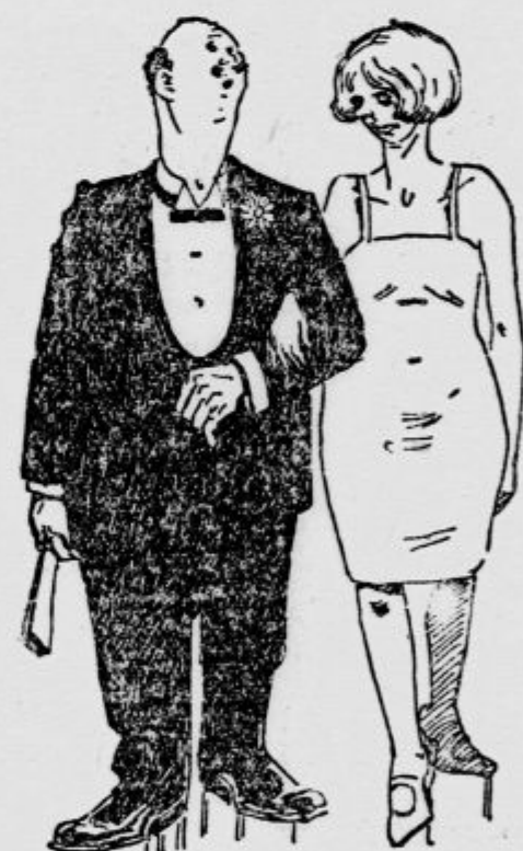
«Tango plešem bolje, toda pri charlestonu delam veliko lepšo figuro.»

V Wellsu na avstrijskem ozemlju živi 8letni učenec A. L., ki se mu je prošle dni v velikem mrazu pripetila prav originalna nezgoda. Nespameten, kakor je, je lizal led, ki se je napravil na ograji cerkve Sv. Mihaela. Nekaj časa se mu je to zdelo zelo prijetno, kmalu pa mu je jezik primrznil in se oprjel ledu. Fant ga ni več mogel odtrati. Začel je tuliti ljudje, ki so videli, da se je jezik prijel ledu in da ga otrok ne more več potegniti v usta, so ga začeli ribati s snegom in s ga posčasi toliko odrekli, da ga je otrok lahko spravil nazaj v usta. Potem so peljali fanta k zdravniku, ki je ugotovil, da je jezik težko poškodovan in da bo treba precej časa, da popolnoma ozdravi.