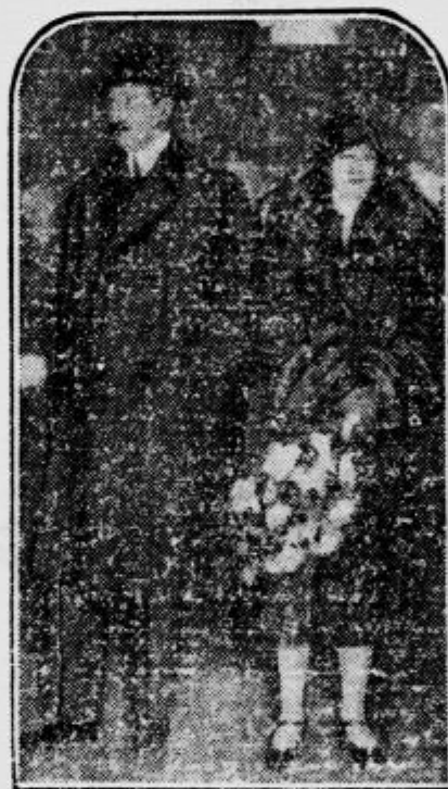
Danski kralj in kraljica sta prišla na obiske v Pariz.

z muziko in prijetem. Po maši so spremlili menihi s prijorjem krsto v grobnico, a tu so jo odnesli menihi sami v tako imenovano »dvorano trohnenja«, kjer ostane 30 do 40 let, dokler se ne spremeni truplo popolnoma v okostnjak. Šele potem se izvrši pravi pokop v grobnici. Tu, v escorialski grobnici, ležijo vsi španski kralji in kraljice od Karla V. dalje. Grobnica ima 26 oddelkov, ki so zasedeni že vsi razen treh. Ljudstvo pravi, da bo konec španskih kraljev, ko bo grobnica napolnjena do zadnjega oddelka.