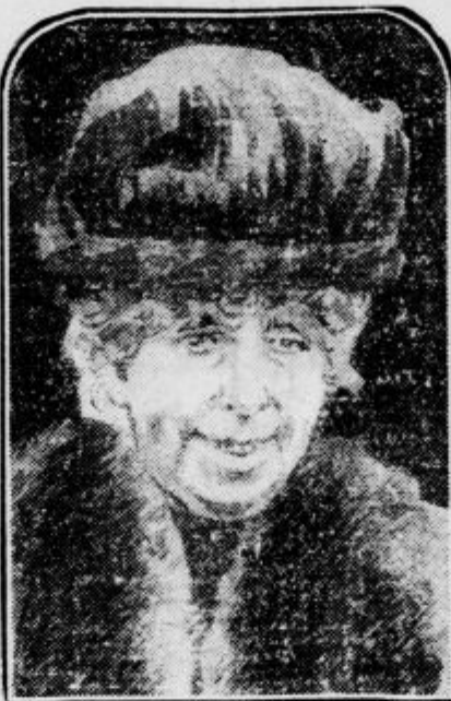
Španska kraljica - mati Marija Kristina

stekleno okence. Komornik, ki čuva ponoči pred spalnico kraljeve družine, je moral priseči, da je truplo res truplo kraljice-matere. Nato so položili krsto na katafalk v samostanski cerkvi, kjer se je pričela svečana žalna maša