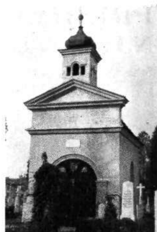
Kapela z grobom A. M. Slomška

Pokopališče stolne in mestne cerkve sv. Janeza Krstnika. 1910 je dosegla pokopališka kriza v Mariboru svoj višek. Staro mestno pokopališče je bilo prenapolnjeno in bi se moralo prej ali slej opustiti, novo na Teznem pa ni bilo blagoslovljeno, tako da ga verniki niso marali. Magdalensko pokopališče na Pobrežju pa je sprejemalo le mrličje iz predmestja, Pobrežja in Teznega. Zato je kupila stolna in mestna župnija 1911 na koncu Teznega ob cesti proti Ptujju lepo in veliko zemljišče vl. št. 160/parc. 651) k. o. Spodnje Radvanje II. del, kjer bi pokopavala vernike mestne in frančiškanske župnije. Še istega leta so postavili velik križ, zgradili ob cesti več grobnic in nato pokopališče blagoslovili. Do 1914 so pokopali tu 85 mrličev. Pokopališče pa je bilo preveč oddaljeno in ni bilo radi pomanjkanja denarja ograjeno. Vrh tega so nastali spori s prejšnjo lastnico Ano Gojčič tako, da se je vknjižila pri omenjenem zemljišču lastninska pravica v prid cerkve šele 1922 na podlagi sodne poravnave. Vse te okoliščine so povzročile, da so pokopališče že 1914 opustili. Nekaj mrličev so prenesli na novo mestno pokopališče, večina pa je ostala na starem prostoru. Danes nudi to pokopališče — če ga smemo tako imenovati — skrajno žalostno sliko: grobnice so razpadle, grobovi preraščeni in komaj vidni, napisi na par še ohranjenih nagrobnikih so skoraj nečitljivi, na posvečenem mestu se pase živina in nihče več ne misli na pokojne, ki so našli tu svoj zadnji dom.