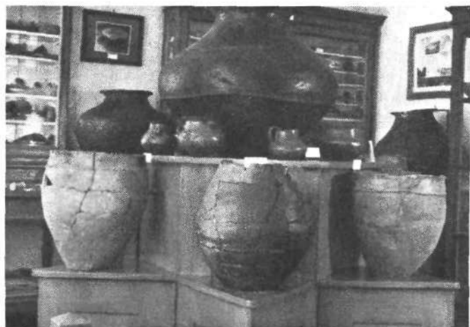
Žare iz hallstattskih grobov na Koroščevi ulici

obliki priveznjenega, nekoliko presekanega stožca. Druge žare so 40—50 cm široke, imajo manj izraženo trebušasto obliko in primeroma večje dno. Poleg pepela in neznatnih ostankov kosti nahajamo v grobnih žarah mestoma več (do 9) večjih ali manjših glinastih darilnih in kulturnih posod. Žare krasi pestre proge vseh vrst in primitivne inkrustacije. Vanje in poleg njih so polagali svojci umrlih glinaste uteži za statve, in bronaste, izjemoma tudi železne predmete kakor ogrlice, zapestnice, prstane, fibule, obeske, sekire, nože, britve, šivanke itd. Najvažnejša najdba pa je glinast kipec prazgodovinskega človeka. Najdene predmete hrani mariborski muzej. — V začetku tega stoletja so našli na mestu palače Okrožnega urada za zavarovanje delavcev ( Sodna ulica ) par planih grobov in bronastih predmetov iz istega časa. — Tudi na Tehtarjih blizu križišča Vrbanove in Koroščeve ulice so bile, kakor je ugotovil H. Pirchegger, prazgodovinske gomile.