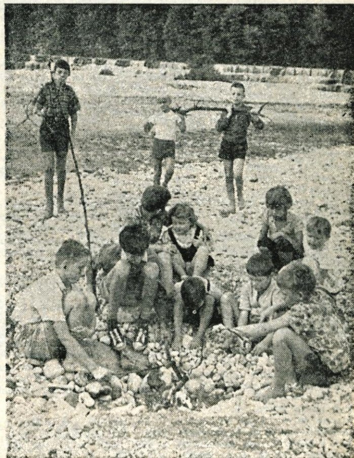
Prijetnih poletnih uric počitnic je konec. Z današnjim dnem se je pričelo novo šolsko leto. Otroci pa bodo kljub temu lahko imeli še dovolj časa za razne igre, če si bodo znali razporediti čas za učenje in vse ostalo. Če jih bodo pri tem usmerjali tudi njihovi starši, pa bo ob koncu šolskega leta spet zvrhana kopica zadovoljstva

Razprava o teh problemih na upravnem odboru minulo sredo da slutiti, da v podjetju pravilno ocenjujejo vse te probleme in da jih bodo v bližnji prihodnosti skušali rešiti. To bo nov uspeh na poti premagovanja podedovanih težav.