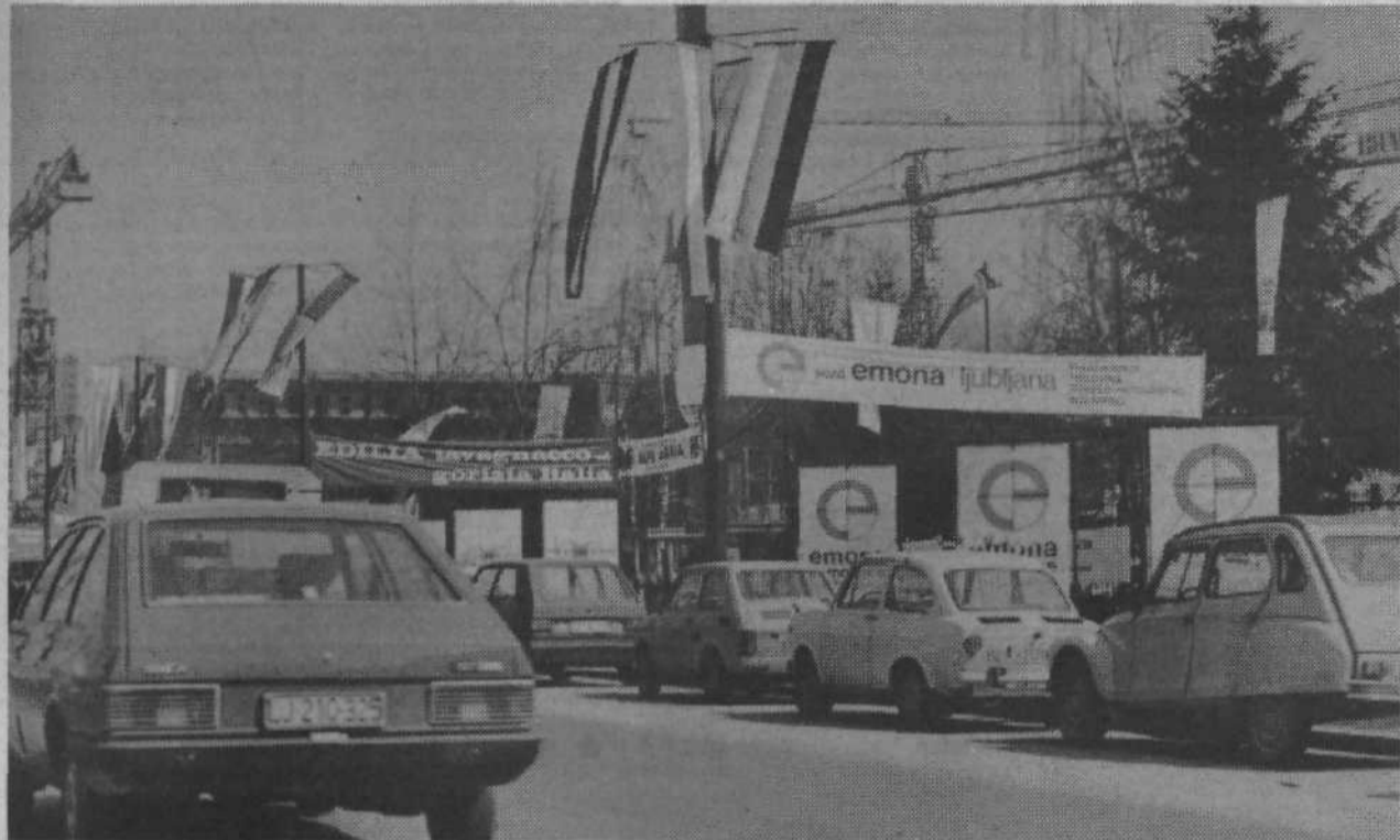
Sejem Alpe-Adria, letos že osemnajsti po vrsti, je presegal vse pričakovane rekorde