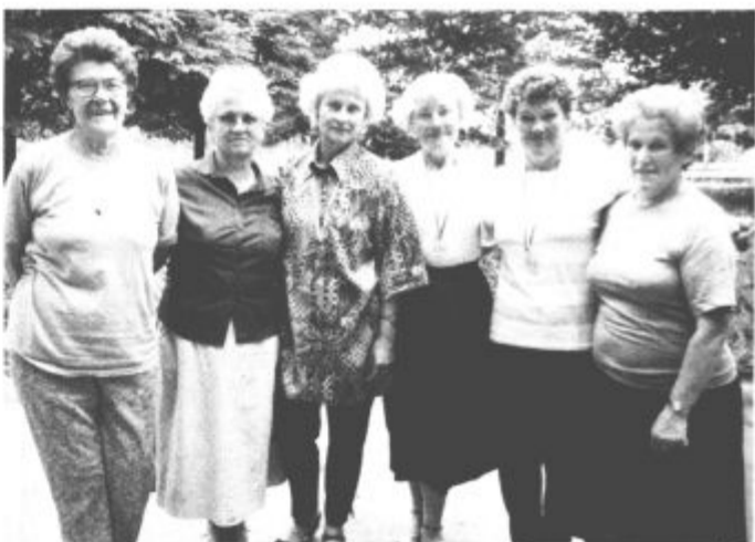
...letos so se jim pridružile še upokojenke