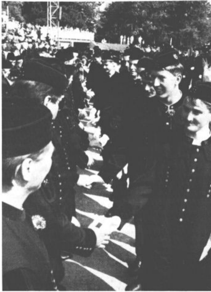
Še stisk roke in postali so ta pravi knapje