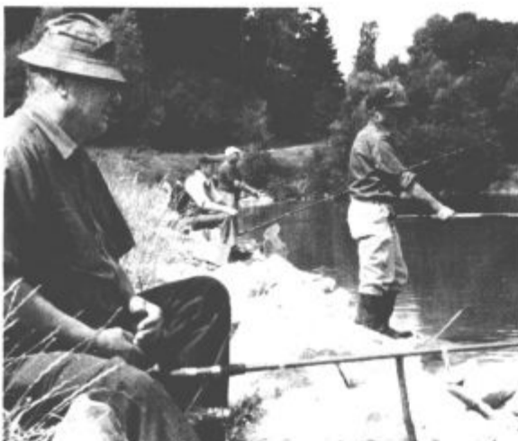
Ribe so enim prijemale bolj, drugim manj, vsi pa so se pošteno trudili