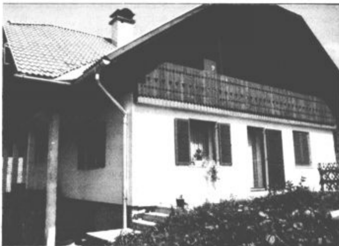
Korenova hiša je zgrajena tudi za potrebe turizma na kmetiji