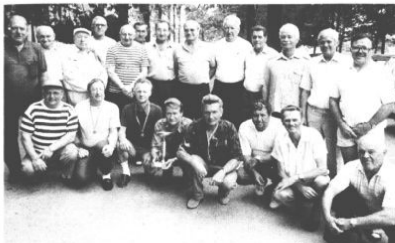
Kegljačev je med upokojenci tudi veliko...