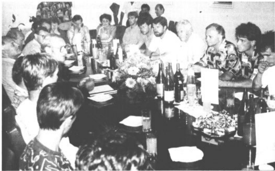
Sprejem pri županu

REZULTATI - nočna tekma za veliko rudarsko svetilko: 1. D. Jekovec 219,4 (75, 81,5), 2. Gostiša (oba Slo) 214,6 (75,5, 78), 3. Jež 213,7 (75, 79,5), 4. Parma 213,4 (75,5, 78,5) in Sakala (vsi Češka) 213,4 (74,5 79,5), 6. Meglič (Slo) 213,3 (75,5, 80), 7. Huber 211,3 (74,5 78,5), 8. Moser (oba Avs) 208,3 (73, 77,5), 9. Dluhoš (Češka) 207,3 (71, 79,5), 10. Petek 206,4 (73,5, 76,5), 11. F. Jekovec 204,6 (74,5 76,5), 12. Zupan 203,7 (72,5, 77), 13. Zupančič 203,2 (72,5, 77), 14. Fras 201,5 (72, 75,5), 15. Kolenc (vsi Slo) 199,8 (70,5, 77,5),...20. Vettori 192,0 (68, 77),...22. Goldberger 184,1 (73, 80,5 p),...31. Kaligaro 175,7 (66,5, 73),...47. Iršič 74,1 (63,5), 50. Murko 72,5 (62,5),...52. Jerman 72 (62,5),...53. Jelen 71,3 (63),...B. Rednjak 67,0 (60),...63. Kopusar 63,1 (58,5); nastopilo je 73 skakalcev iz 4 držav. 3. Ski jumping challenger - polfinale zmagovalcev: Fras: D. Jekovec 77,5 (p); 77,5 (p), Gostiša: Petek 79,5; 77,5; polfinale poražencev: Vettori: Parma 79:73, F. Jekovec: Zupan 75:74; finale - za 7. mesto: Parma: Zupan 80,5:78,5; za 5. mesto: Vettori: F. Jekovec 79,5:77,5; za 3. mesto: D. Jekovec: Petek 80,5:78,5; za 1. mesto: Gostiša: Fras 79,5:77,5.