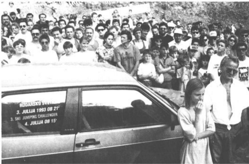
Vsi so čakali. Tudi nanjo.