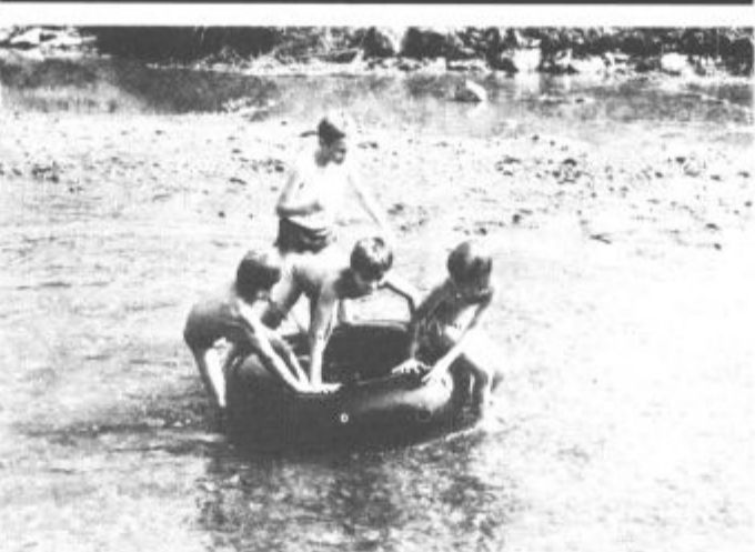
Poletna vročina zadnjih dni je, posebno otroke, zvalila v reke in potoke, kjer se hladijo in igrajo. Veselo razpoloženi so tudi tle štirje, ki se hladijo v Boljski. ■ Besedilo in slika: -er