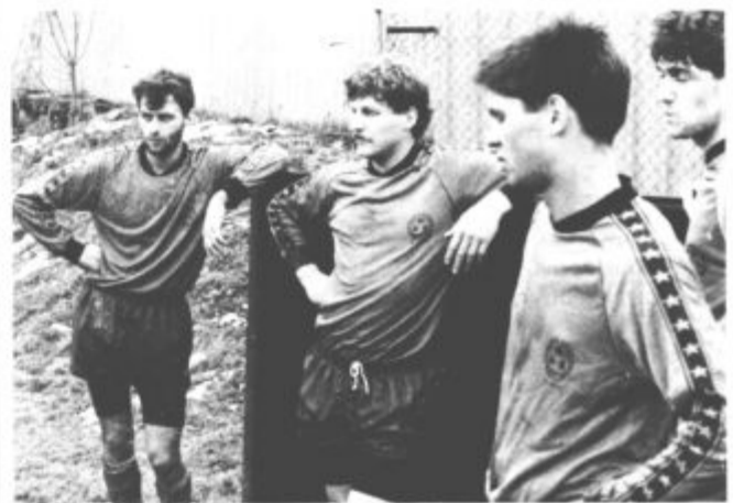
V ponedeljek se je končal prestopni rok za nogometaše. V velenjskem Rudarju niso posebej zadovoljni. Še zlasti, ker bi Mariborčani radi dobili poceni Kariča. (vos) Stran 11