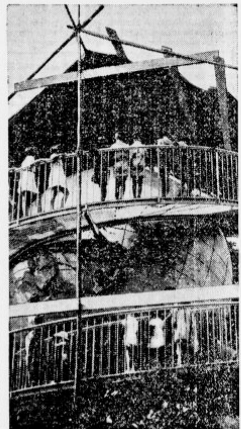
Model za največji most sveta, ki ga bodo zgradili v luci S. Francisco

Muzej za fotografske aparate. V Washingtonu so otvorili muzej, kjer je zbirka fotografskih aparatov od najpreprostejšega do najboljega. Zlasti so znameniti detektivski in vohunski aparati, ki so nekateri tako majhni ko gumb. Neka vohunka je imela tak majcen aparat, da ga je skrila v barvilo za ustnice! — Leta in leta je fotografirala z njim.