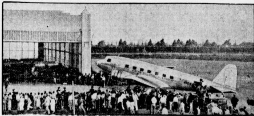
Mrtvi svetovni letalec Post in tovariši na mrtvaški poti v domovino

Po nekaterih madjarskih občinah divjajo razne bolezni in je mnogo slučajev legarja — skoraj same posledice — lakote in prepilne hrane. Madjarska ima 700.000 brezposelnih ljudi, če prištejemo še člane družin, je kakih 3 milijone ljudi lačnih. Ker je letos madjarska letina slaba, bo še huje. Po več krajih niso ljudje že več mesecev videli ne mesa ne kruha in jedo le sirovo zelenjavo in sadje. Zato ni čudno, da so vsi oslabljeni in ne morejo ničesar delati. Madjarska se rada pobaha, da zaposluje tuje delavstvo; v resnici pa niti svojega ne more preživljati. Več ko pol milijona ljudi bi se rado izselilo iz Madjarske.