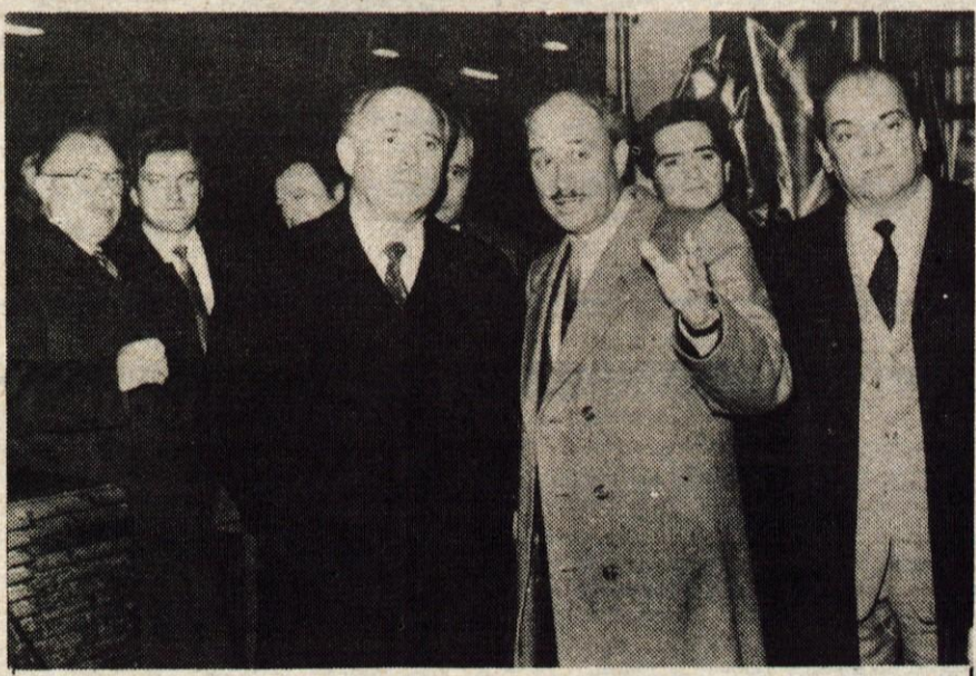
Delegacija deželne vlade Koroške v Sloveniji — Dvodnevni obisk najvišjih predstavnikov dežele Koroške, ki jih je vodil glavar Leopold Wagner, je bil uspešen. To sta potrdila tako Wagner in njegovi sodelavci kot predsednik slovenskega izvršnega sveta Dušan Šinigoj. Posebej so poudarili pomen krepitve delovne skupnosti Alpe Jadran, sodelovanja Slovenije in Koroške pri graditvi predora pod Karavankami in varstva okolja. Odkriti so bili tudi pogovori o položaju slovenske narodnostne skupnosti na Koroškem. Wagner je Dušana Šinigoja povabil na obisk na Koroško. Delegacija sosednje dežele je obiskala tudi kranjsko Savo (na sliki). — (jk)