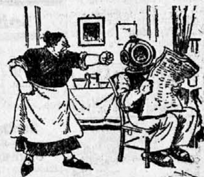
Potapljač pred svojo Ksant'po.

Kmet, ki se je ravnal po navodilih, je ob izbruhu malarije v vasi ostal živ, njegov sosed, ki je stalno hvalil svojo bistroumnost, se pa ni brigal za zdravljenje s kininom in je umrl.