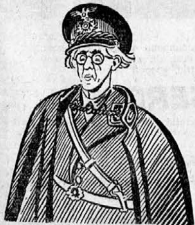
PROF. DR. TUKA

Človeška sila znaša povprečno desetino konjske sile, turbina Dnjeprostroja v Rusiji ima 90.000 ks, vse vodne sile na zemlji 30 milijonov ks.