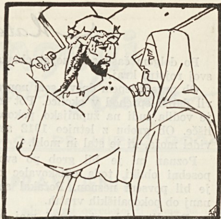
France Gorše: Jezus sreča svojo žalostno mater. 4. postaja križevega pota v semenišču v Adrogué, Argentina

Kadar boš imela opraviti s pogani, kakršnimikoli, moraš biti na to, da jih razumeš, ne razumeš jih obsodjaš, da jim obrneš obraz ali da se