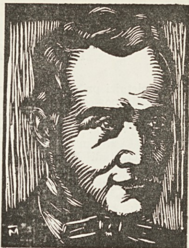
Anton Janežič (1828—1869)

Posebno zaželjeni bodo sestavki pisani v: