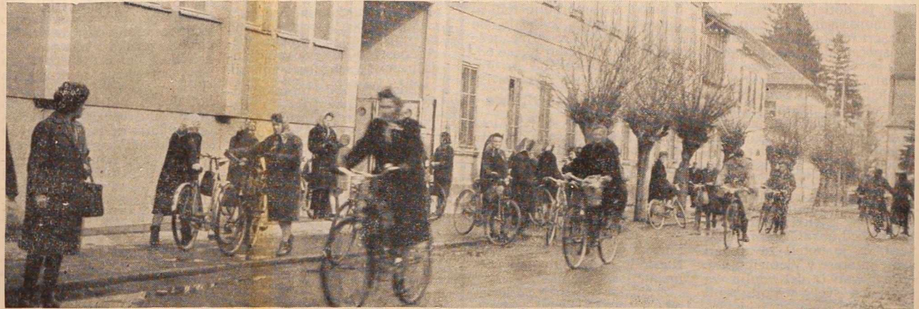
Šakdanji prizor pred tovarno perila Mura, kjer so zaposlene predvsem žene