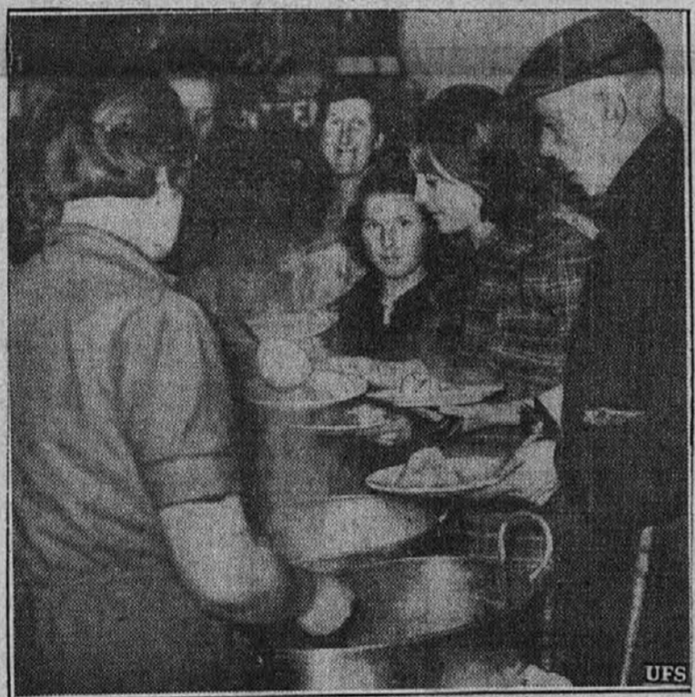
Tako delijo na Angleškem hrano brezdomcem, katerih domove so porušile nemške bombe. Pripravljene so posečne kuhinje, ki skrbijo, da ti nesrečneži vsaj enkrat na dan dobijo kaj toplega v svoje želodce. Slika je poslana iz Londona.