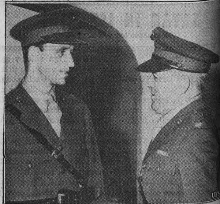
Levi na sliki je rezervni kapitan James Roosevelt, se je v Los Angeles javil pri svojem poveljniku majorju W. S. Van Dyke predno je prevzel poveljstvo pri komandni 22. bataljona.