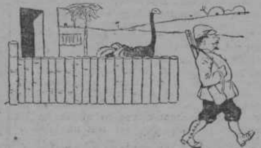
Ali vidite noja tam za ograjo? Gleda sicer proti lovcu, toda ga ne vidi — ker je to le rep opice. Pa kdo bi zameril opici, če ne vidi z repom lovca, ko lovec ne vidi opice z očmi in gre kar lepo mimo!...