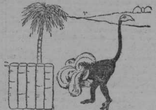
Malo nerodno je tako-le narobe-svet hoditi: glavo pri tleh — rep pokonci! Toda sila kola lomi — in opica se v tej našemljenosti ni prav nič bala lovca...