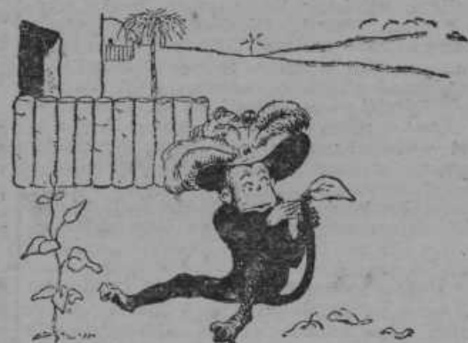
In se lapuhov list pride pod roko — ne, pod tacco!