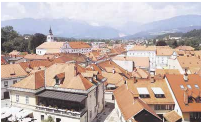
Razgled na Kamnik z Malega gradu

Kolumne izražajo stališča avtorjev in ne nujno uredništva glasila Slamnik.