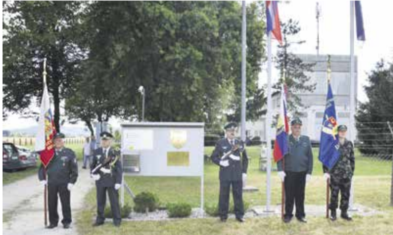
Počastitev spomina na rojstvo naše države

Ob trideseti obletnici naše države smo se na radio oddajniku Domžale zbrali tisti, ki smo ga leta 1991 branili.