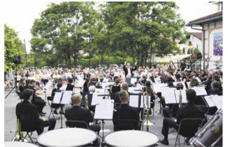
Dvorišče Kulturnega doma Franca Bernika se je izkazalo za nadvse primerno koncertno prizorišče.