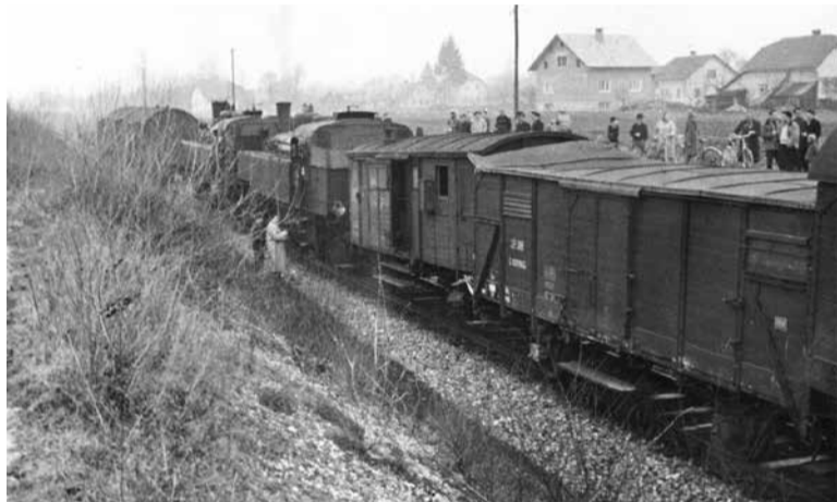
3. decembra 1959 sta na železniški postaji v Domžalah trčili lokomotivi. Človeških žrtev ob trčenju ni bilo, materialna škoda pa je bila velika. Privabila je veliko firbcev.

gorel leseni nadvoz nad progo in je bila tako popolnoma prekinjena cesta Črnuče–Šentjakob. Ko so nadvoz obnovili, je 8. novembra 1952 osební avto, last višjega oficirja letalstva, podrl ograjo na levi strani in padel na progo. Nihče od petih, močno vinenih potnikov, ki so se vračali iz gostilne Burica v Dragomlju, ni bil težje poškodovan.