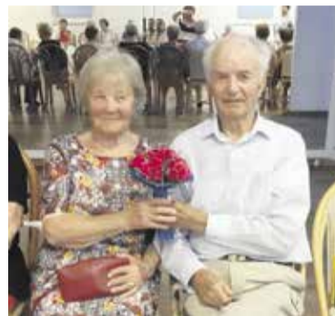
Najstarejši zakonski par društva MDJC

Večdnevno letovanje starejših v okviru vodnega programa je eden izmed priljubljenih programov v MD Jesenski cvet. Tabor je namenjen druženju starejših, njihovem povezovanju in širjenju socialne mreže. Je pri-