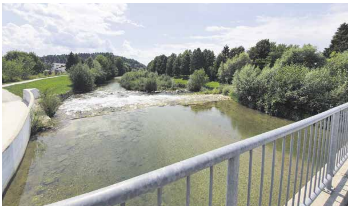
Sanacija sipine v Kamniški Bistrici v Domžalah

Na relaciji Gorjuša-Žeje-Sv. Trojica-Vrhopolje je bila postavljena nova prometna signalizacija. Zaradi vse večjega števila rekreativnih kolesarjev se na cestah, predvsem v hribovitih okoljih, povečuje problem prometne varnosti. Znak poziva k upoštevanju ustreznih bočne varnostne razdalje med kolesarjem in vozilom v prehitevanju, ki mora biti najmanj 1,5 m. Voznike prosimo, da upoštevate omejitve hitrosti in postavljeno prometno signalizacijo za varnosti kolesarjev in tudi drugih udeležencev v prometu.