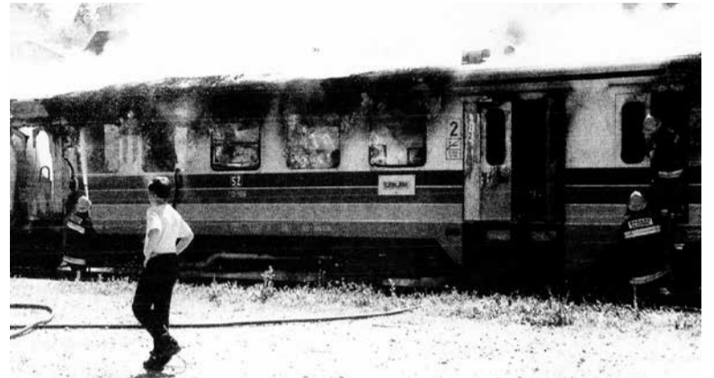
V Kamniku so vandali 9. junija 1999 zažgali vlak, ki je popolnoma pogorel. Povzročiteljev niso nikoli našli.

Med vsemi nesrečami na kamniški progi so najbolj odmevale smrtno nesreče na nivojskem križanju ceste in proge v Depali vasi. Na tem nezavarovanem prehodu se jih je zgodilo več. Kljub prošnjam, potem pa ob vse bolj glasnih zahtevah prebivalcev Depale vasi, se oblasti (tako občinske kot železniške) dolgo časa niso zganile. Ljudje so se morali organizirati civilno. Na iniciativo ob-