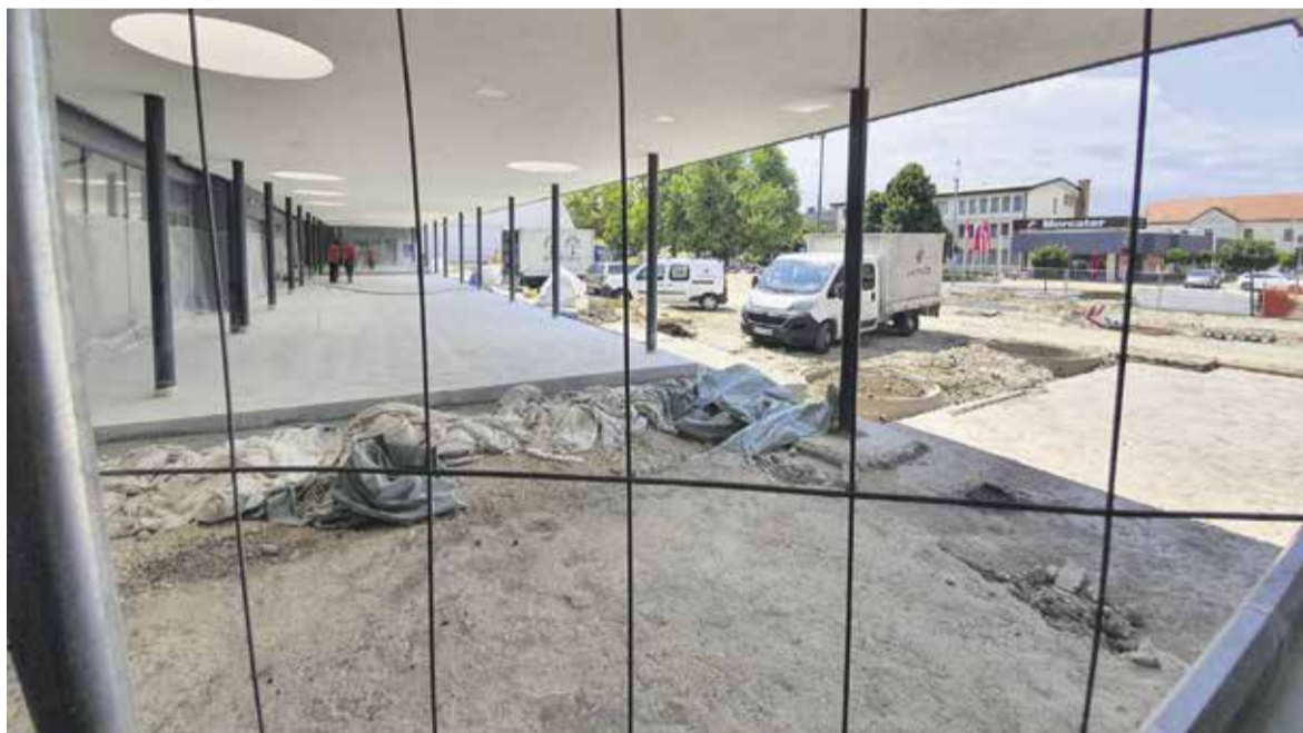
Ureditev ploščadi pred veleblagovnico

V središču Domžal se v smeri proti Kamniku izvaja prenova avtobusnega postajališča. Novo avtobusno postajališče pri veleblagovnici bo še vedno vključevalo pretežno steklene površine, saj želimo obdržati čim bolj odprt in pregleden prostor, prav tako bo primerno osvetljeno in opremljeno z informativnim zaslonom. Potek kolesarske steze ostaja nespremenjen, enako tudi klopce izven postajališča. Postavitev dvostranskega informativnega zaslona ter obnova obstoječih postajališč, vključno z novimi klopmi na postajališču, naša 39,518,20 evra brez DDV.