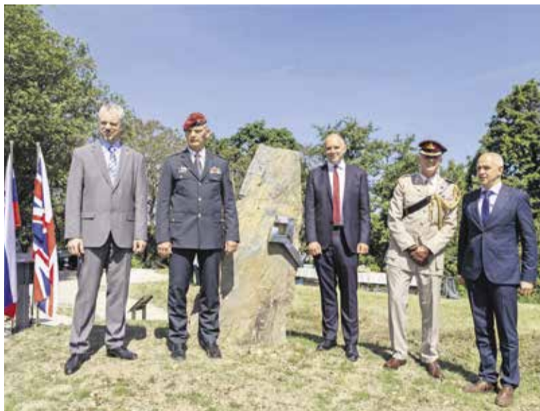
Gostje ob spomeniku