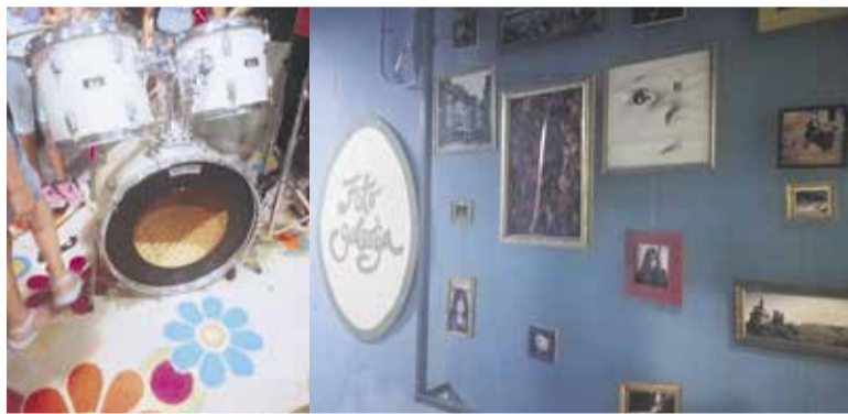
Mladinski center Kotlovnica v Kamniku