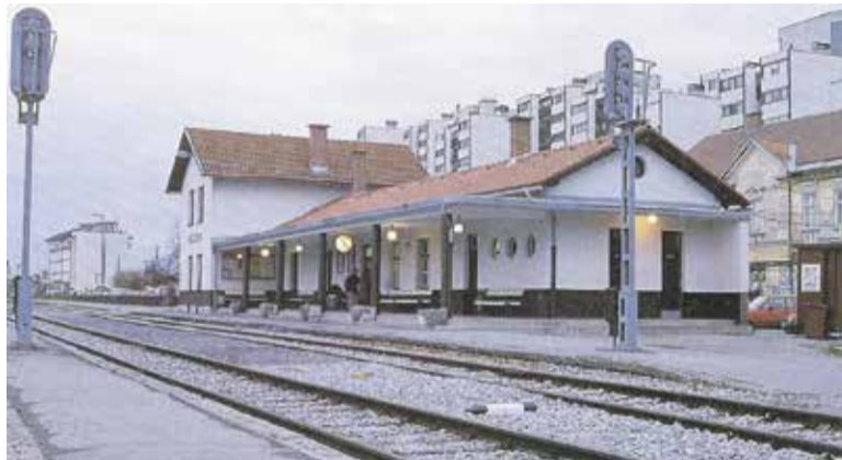
V 130-letni zgodovini je železniška postaja v Domžalah doživela marsikaj, od sprejemov državnikov do tega, da so jo požgali vandalski uničevalci.

Nevsakdanja nesreče se je pripetila 15. junija 1950 v Črnučah, ko je za-