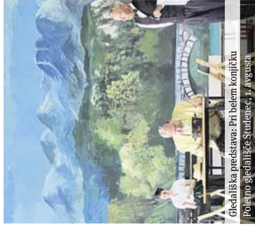
Gledališka predstava: Pri belem konjičku Poletno gledališče Studenec, 1. avgusta