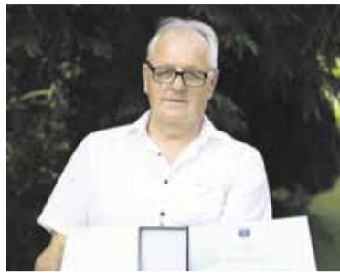
Srebrna plaketa – OZ RK Domžale