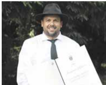
Bronasta plaketa – KD Domžalski rogisti