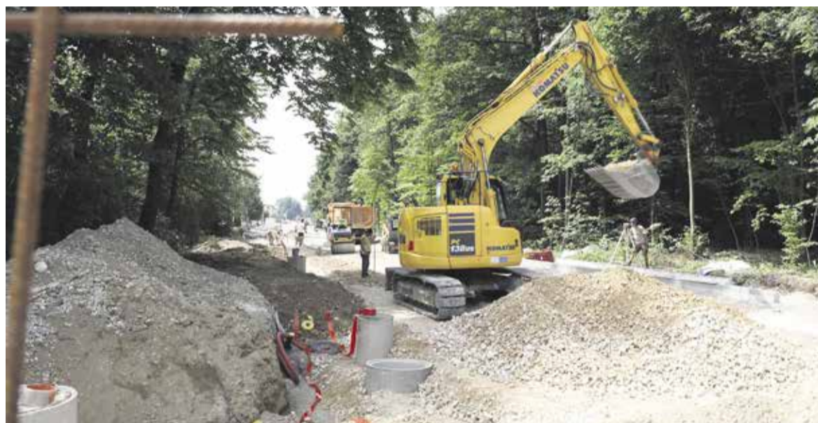
Dela na Igriški cesti v Jaršah

sko-vzdrževalnimi deli na vodovodu na Goričici pri Ihanu. Na Gasilski poti v Jaršah, Kokaljevi in Rudniški ulici so zaključena obnovitvena dela na vodovodu in kanalizaciji ter na hišnih vodovodnih priključkih. Potekajo zaključna dela na vzpostavitvi pešcevih in vozniških površin. Na Igriški ulici v Jaršah je vzpostavljena popolna zapora ceste zaradi rekonstrukcije ceste in izgradnje obojestranskega pločnika. Dela bodo predvidoma zaključena do 1. septembra 2021. Na Opekarniški cesti v Radomljah je obnovljeno meteorno in fekalno kanalizacijsko omrežje, predstavljena javna razsvetljava, položeni so elektro vodi. Trenutno se izvaja hodnik za pešce, sledi asfaltiranje vozišča. Dela bodo predvidoma zaključena do konca avgusta 2021. Na cesti skozi Škrjančevo, Vir-Radomlje je obnovljeno vodovodno in kanalizacijsko omrežje, predstavljena javna razsvetljava. Trenutno sta v delu avtobusna postaja in hodnik za pešce, sledi asfaltiranje vozišča. Poteka tudi obnova dilatacij na nadvozu nad AC-izvoz Domžale. Sanirana je bila hidroizolacija na območju vgradnje dilatacij. V teku je vgradnja dilatacij na obeh straneh nadvoza. Sledi končno asfaltiranje, predvidoma v sredini avgusta 2021.