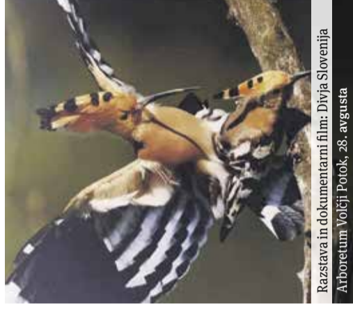
Razstava in dokumentarni film: Divja Slovenija Arboretum Volčji Potok, 28. avgusta