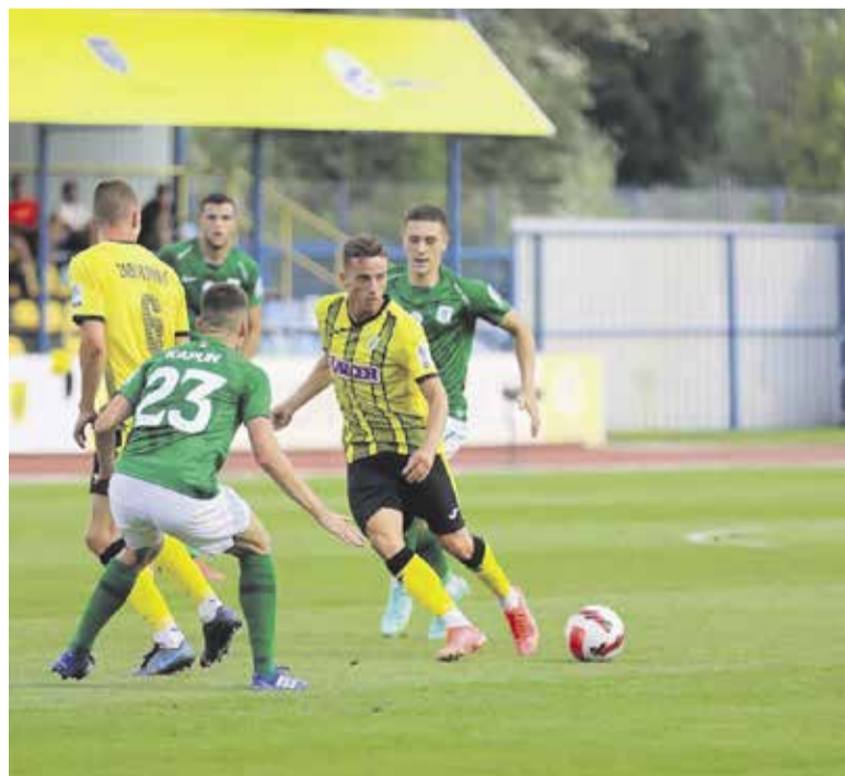
Mlinarji se na uvodu sezone še zdaleč niso ustrašili tekmecev.