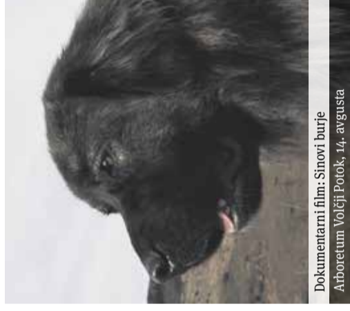
Dokumentarni film: Sinovi burje Arboretum Volčji Potok, 14. avgusta