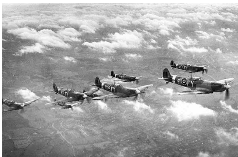
Formacija letal Spitfire