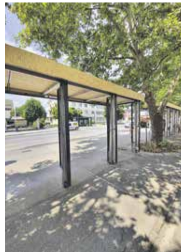
Prenova avtobusnega postajališča v smeri Kamnika