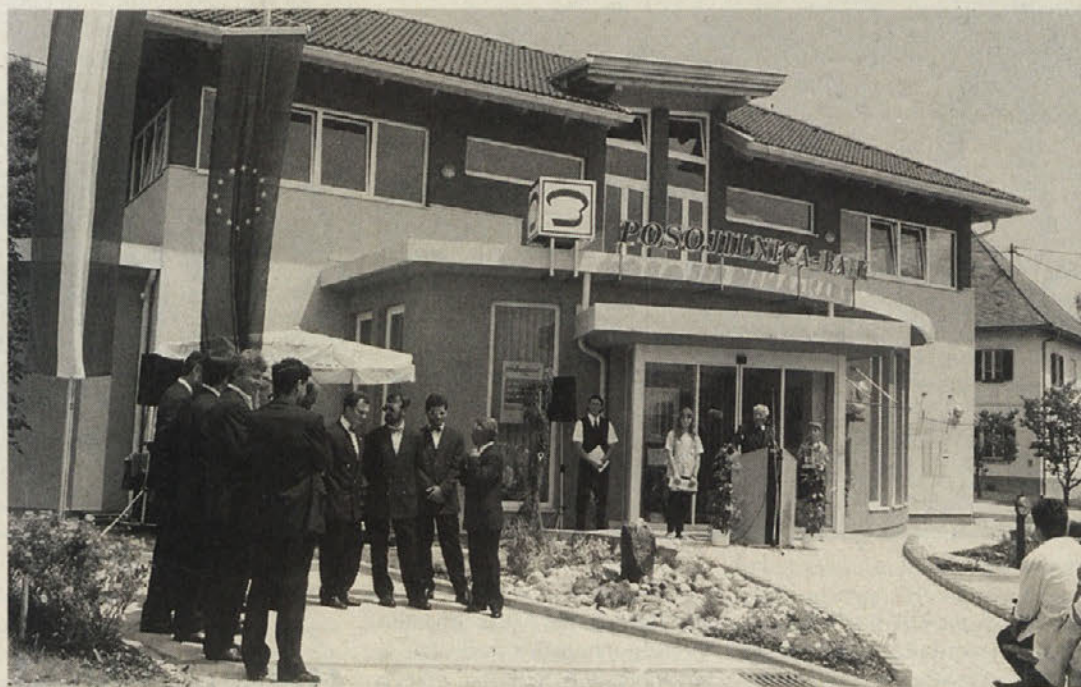
Moški zbor domačega prosvetnega društva, katerega podpira tudi Posojilnica-Bank

Znano dejstvo je, da slovesnosti brez nagovora ni. V ne-