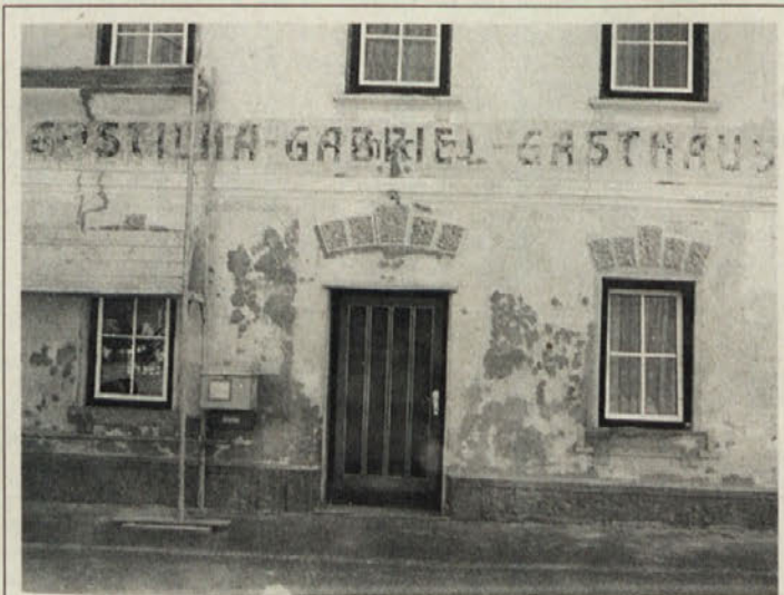
PRI OBNOVAH starejših poslopij pride marsikaj na dan. V Šentjanžu obnavljajo fasado znane Tišlarjeve gostilne. In glej, izpod beleže, ki so ga odstranili, se je prisvetil na dan znani, a več let zabrisani dvojezični napis GOSTILNA GABRIEL GASTHAUS. Morda ga bojo pa pustili, saj je dokaz, da je tu svojčas bil družabni in kulturni center vasi oz. fare.