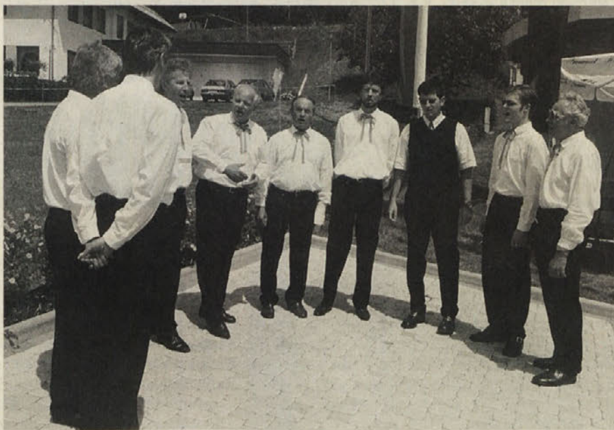
Moški zbor »Vaščanə pojo«