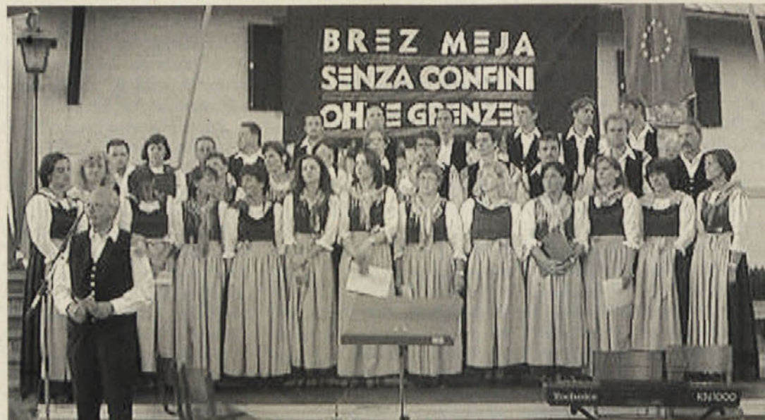
Predsednik SPD Radiše je pozdravil goste, domači mešani zbor pa jim je zapel dobrodošlico