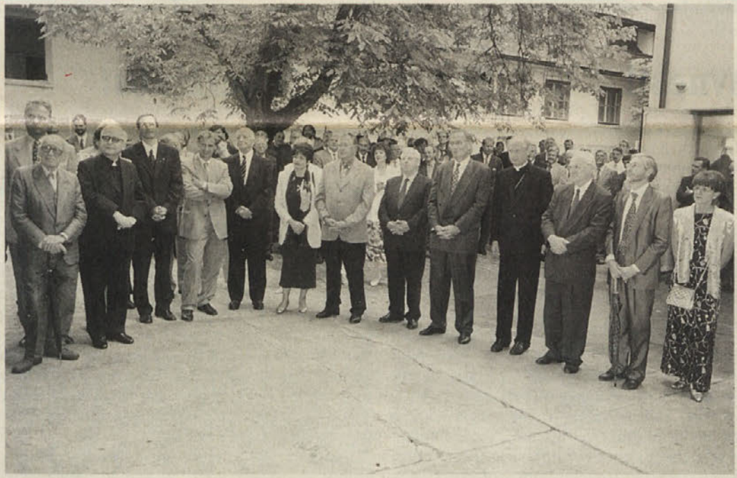
Na vrtu generalnega konzulata je bil sprejem ob 7. obletnici osamosvojitve Republike Slovenije, kamor so prišli vidni zastopniki koroške politike in gospodarstva ter zastopniki manjšinskih organizacij.

Kljub trenutni zvezni zadolženosti Smolleja deželna politika hudo mika. V ponedeljek je sicer dejal, da ne namerava biti deželnozborni kandidat ali poslanec »Demokracije 99«, češ »ne potegujem se za mesto pod južnim soncem«. Platformi hoče le pomagati, da bo dobila čim več glasov. A če nekdo stalno in ostenativno govori o sebi kot o tisti osebi, ki »hoče« ali »upa« v tej deželi nekaj spremeniti, potem ne bi bilo čudno, če bi ga v primeru volilnega uspeha »Demokracije 99« njegova zrcalna slika nekega dne pozdravila »Dobro jutro, gospod deželnozborni poslanec«.