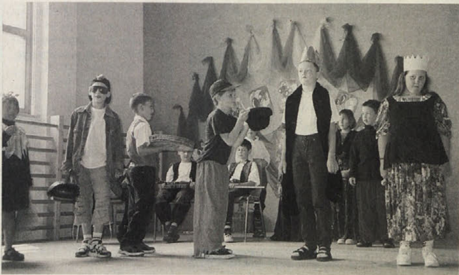
Učenci škofiške ljudske šole pri izvedbi Trnuljčice

Škofiška dvojezična prireditev ponovno potrjuje, da mnogi