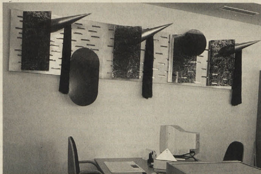
Umetnina priznane avstrijske umetnice,