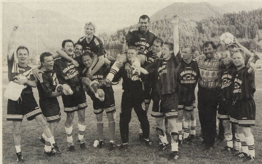
HURA! Nogometaši Globasnice so napredovali v podligo. Veliko uspehov v prihodnji sezoni!