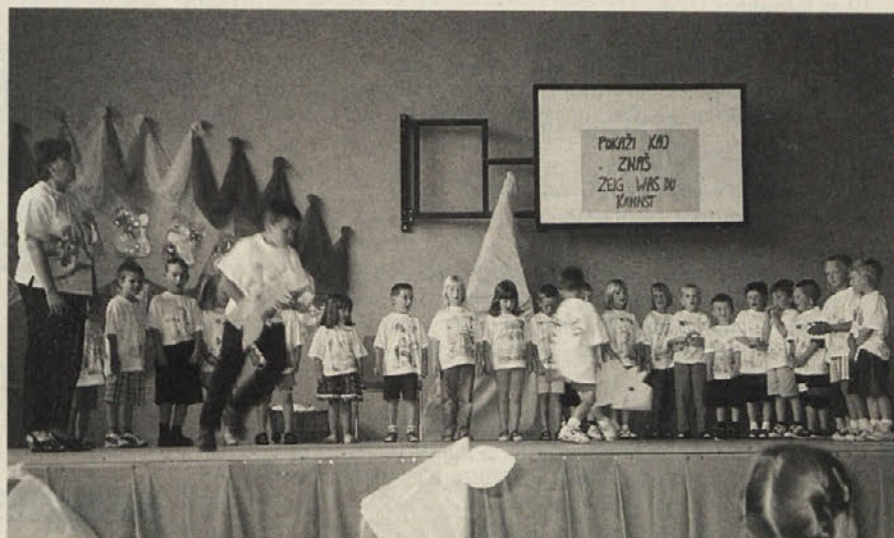
Pogumen nastop otrok dvojezičnega vrtca