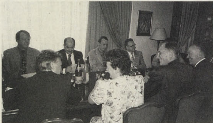
Predstavniki slovenskih organizacij na Koroškem ob sprejemu pri slovenskem zunanjem ministru Borisu Frlecu

Frlec se je srečal in pogovarjal tudi z državnozbornim poslancem Karlom Smollejem. Dejal je, da si od njegovega delovanja tudi Slovenija pričakuje veliko, je pa svaril pred tem, da bi mu naložili »prehuda bremena«.