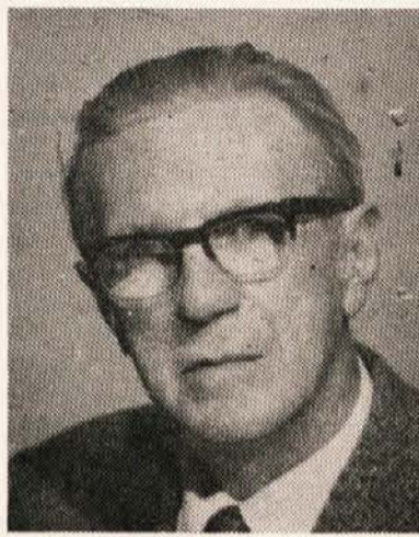
HARTMAN Folli Klopinj