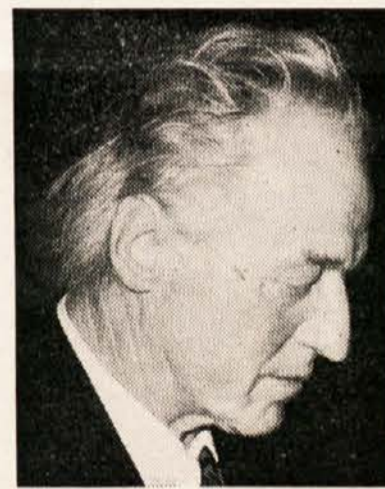
ROPAC Jože Loče ob Dravi