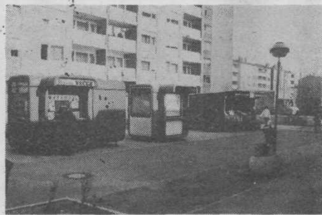
Pred Namo je poleg kioskov Tobaka in Ljubljanskih mlekarin postal PIK Vinkovci — tozd BORINCI ličen, zaprt prodajni pult za prodajo sadja in zelenjave.