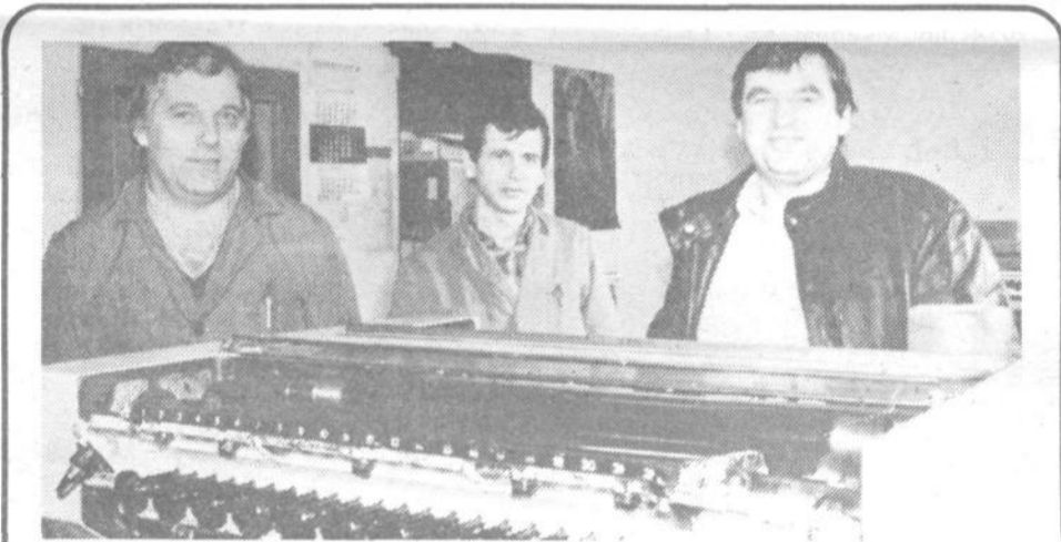
»Dogaja se že, da so uvoženi materiali cenejši od domačih. Samokopirni papir iz ZRN in Finske ni le cenejši od papirja z AERA, ampak predvsem znatno boljši, saj uporabniku omogoča kar petnajst neoporečnih kopij. Preneti bomo morali z bojem za (pre)visoke cene na domačem tržišču, ampak pričeti z akcijo za evropsko kakovost za domačega kupca,« so ocenili dogajanja na domačem trgu polizdelkov člani skupne obratovalnice VAT-grafika s Kopaliska 4.