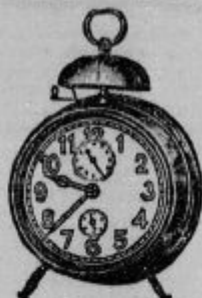
Št. 123. Budilka 16 cm vis., obra kolenja, štetno jam- sivo . . . . . Din 45- Št. 125. Eonka 19 cm visoka . . . . . Din 64-20 Št. 126. Eonka z 8 il. 8 ev. n kazalo . . . . . Din 75- Št. 128. K. vi. žepna ura z obrn kol s m 2 let o jam-tvo . . . . . Din 44- Št. 121. Eonka z radij, te v ikam n kazalci D n 55-

Največja in najsolidnejša razpošiljalnica — Razpošilja v vse kraje tu- in inozemstva Lastna protokollirana tovarna ur v Švici znam: 'KO - OM KO - AXO