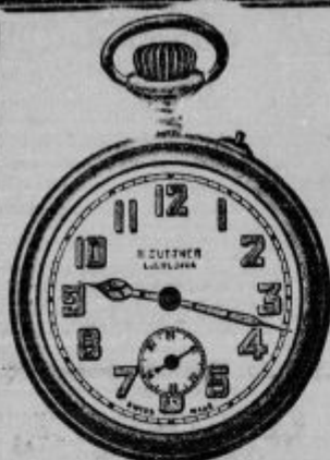
Št. 122. Kovinska anker-košopč. s sekundnim kazalcem, dobro koleško, radi- am svetilka očes se -ter lke in kazalec samo D št. - št. 122-1. Ista brez sekund. kazalca D št. 67-