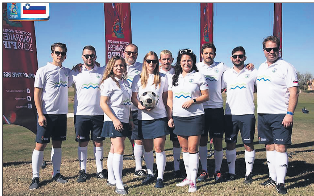
Slovenska delegacija na SP v Maroku

Prvi uradni dan tekmovalja je bilo precej vetrovno, Slovenci se v takšnih pogojih nismo najbolje znašli in smo vsi vknjižili slabše rezultate od pričakovanih. Enostavno smo preveč tvegali, kar se nam je v takšnih pogojih maščevalo in smo si nabrali precej plus točk, ki smo jih kasneje nižali skozi vse preostale dni. Treba pa je dodati, da so bila igrišča zelo zahtevna, primerna pač tekmi za naslov svetovnega prvaka. Največja razlika z našimi igrišči je bila v tem, da so tam veliko hitrejši t. i. greeni, na katerih so luknje. Vsaka napaka se hitro kaznuje.«