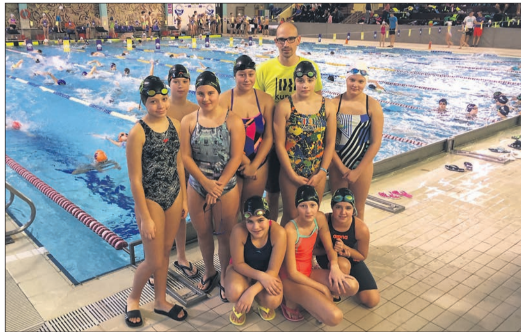
Ekipa PA Kurent na tekmovalju v Celju