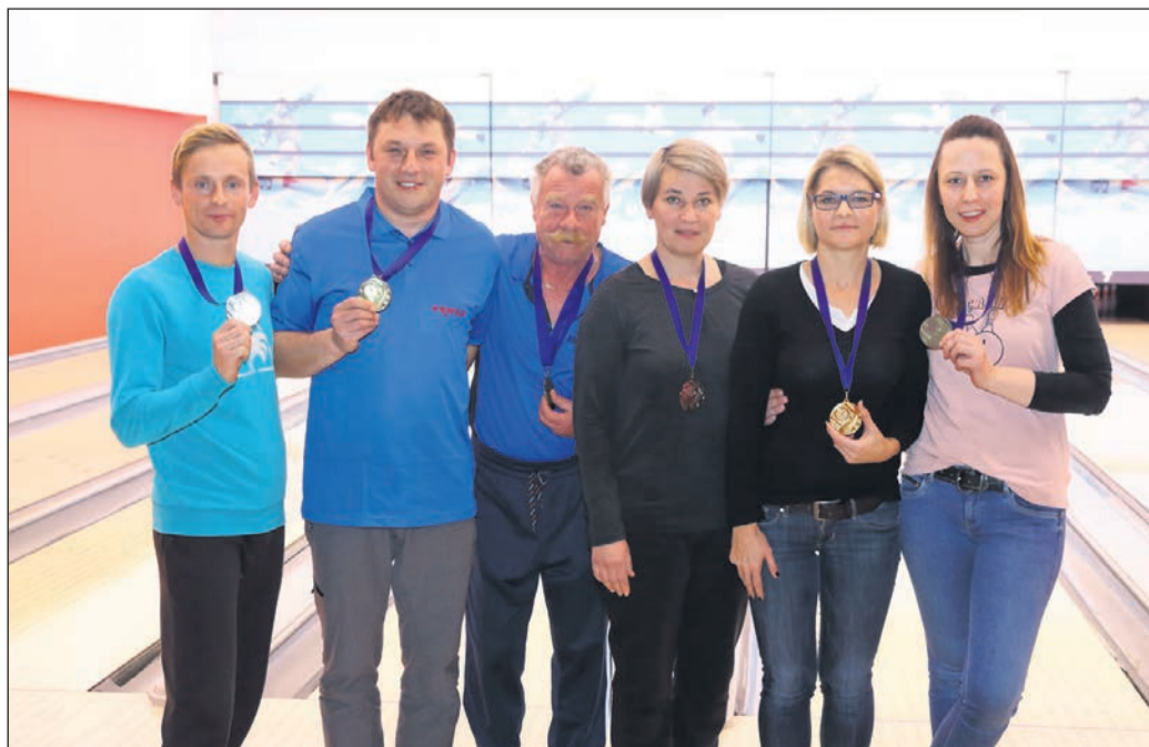
Najboljši trije posamezniki in posameznice zaključnega turnirja