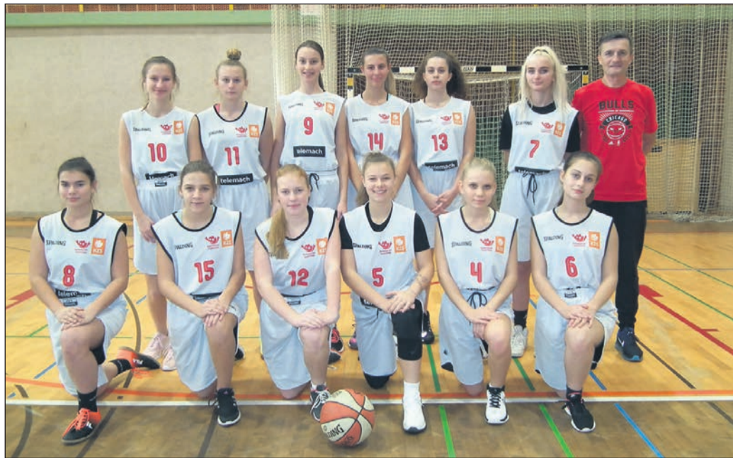
Zmagovalna ekipa območnega tekmovanja v košarki za dekleta: OŠ Markovci

OŠ Kajetana Koviča Poljčane – OŠ Markovci 11:33, OŠ Majšperk – OŠ Anice Černejeve Makole 26:31; tekma za 3. mesto: OŠ Kajetana Koviča Poljčane – OŠ Majšperk 29:37; tekma za 1. mesto: OŠ Markov-