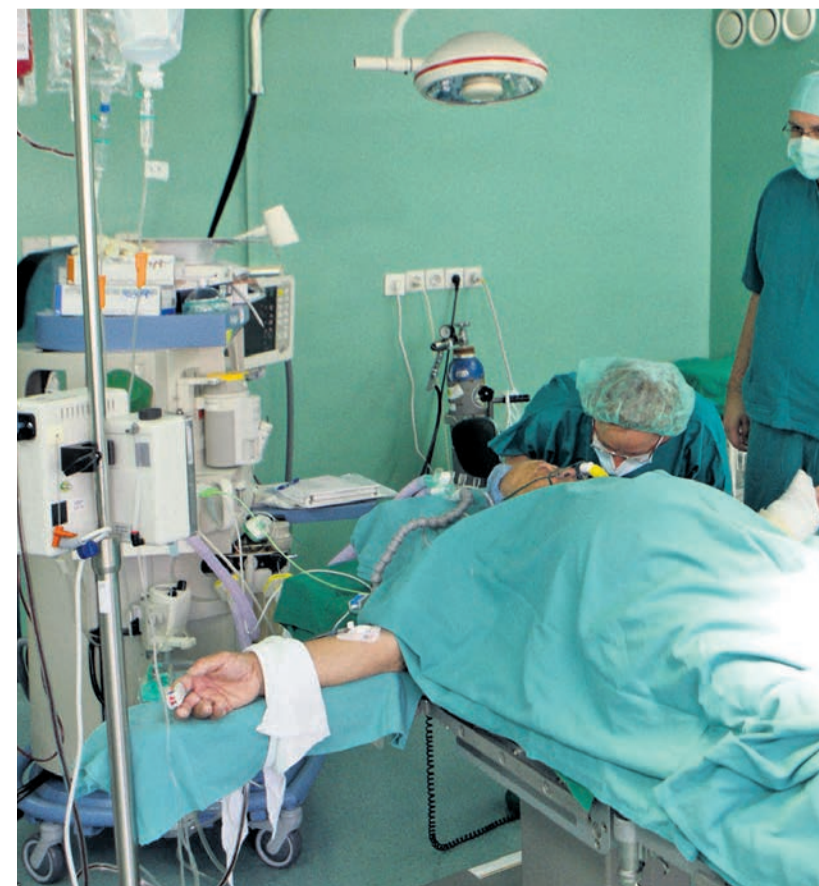
Se ptujski bolnišnici obeta krčenje programov?

V bolnišnici že delajo analize, kaj bi zaposlitev pomenila s finančne plati. Se pa sprašujejo, ali je morda