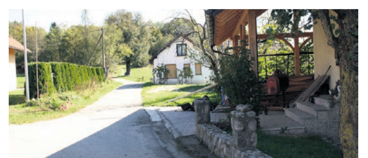
Inšpektorji so odkrili 95 nelegalnih gradenj, štiri neskladne in 18 nevarnih gradenj.

denj ter rok za odstranitev objektov. Inšpekcija je v sklopu akcije odkrila štiri neskladne in 18 nevarnih gradenj. Za slednje so bile odredene takojšnje prepovedi uporabe objektov in rok za njihovo odstranitev oziroma zavarovanje. V sklopu akcije sta bili izdani dve odločbi, s katerima je bila prepovedana uporaba objektov, ker se jima je spremenila namembnost brez gradbenega dovoljenja.