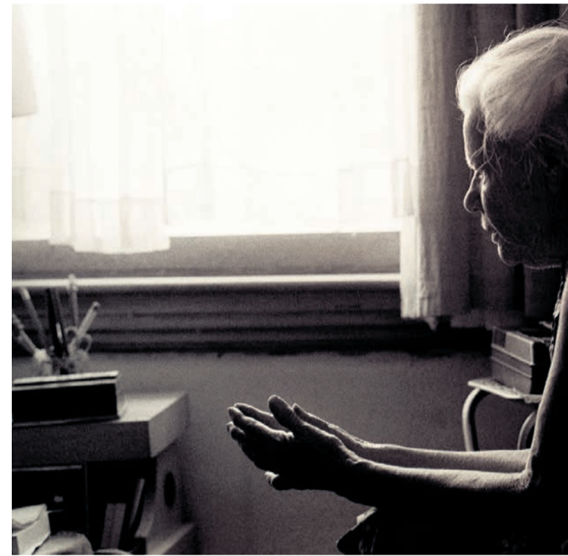
Lanski dvig cene storitve pomoči na domu se bolj kot na občinskih proračunih

marca lani znaša 17,85 evra na uro. Zakon o socialnem varstvu določa, da občine financirajo storitev pomoči družini na domu najmanj v višini polovice cene storitve. Za 15 spodnjepodravskih občin je ta znesek za lansko leto (januar–november) znašal 278.812 evrov. „Opažamo,