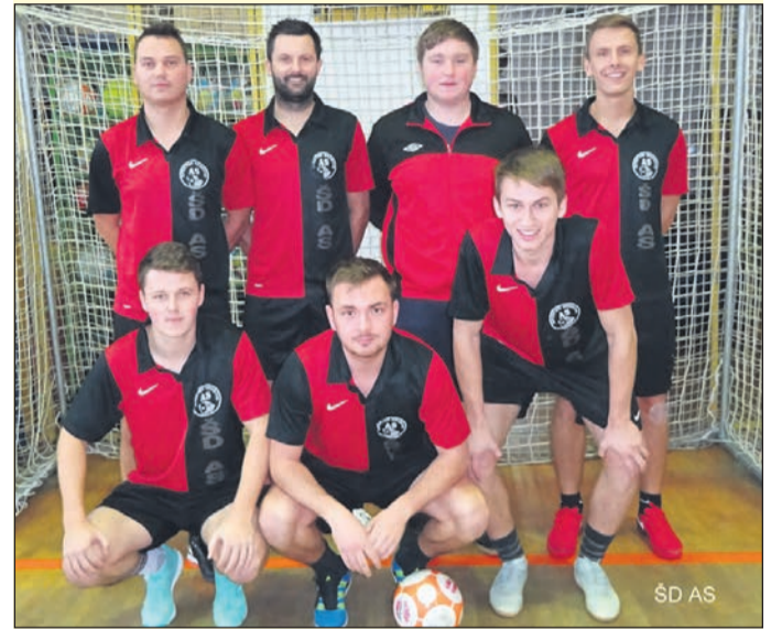
Ekipa ŠD As, trenutno drugouvrščena ekipa članske lige