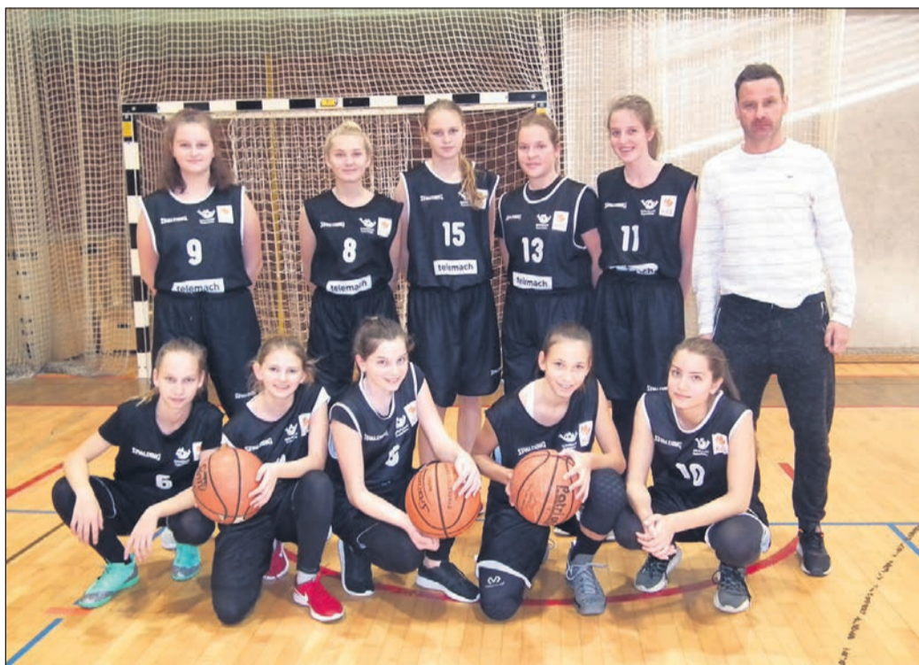
Ob Markovčankah so se na državno tekmovanje uvrstile tudi učenke OŠ Anice Černejeve Makole.