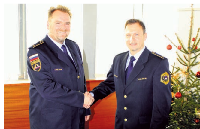
Dosedanji in novi komandir ob primopredaji funkcije