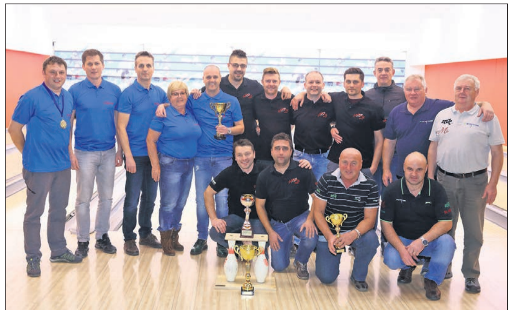
Pokal za najboljšo ekipo jesenske lige 2018 je prejela ekipa Spirala (v sredini), 2. mesto je zasedla ekipa Tames (levo), 3. mesto pa VGP Drava.