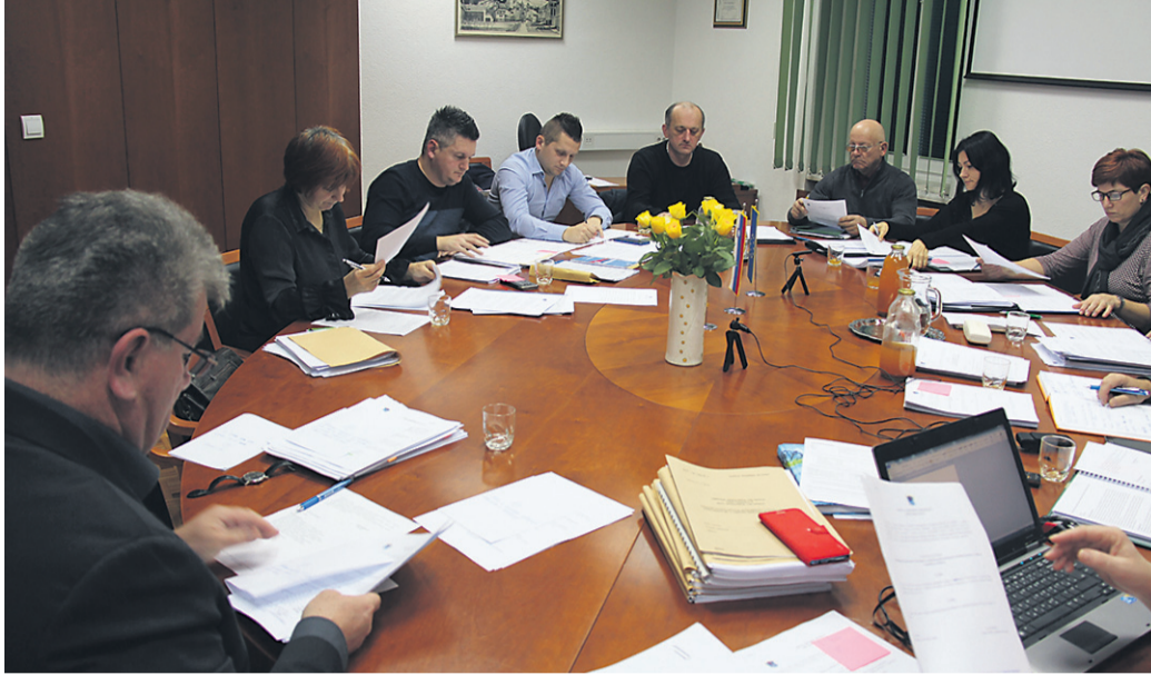
Novoizvoljeni svetniki so proračun za leto 2019 potrdili brez uprašanj in razprave.

Svetniki občine Središče ob Dravi so na decembrski seji potrdili tudi