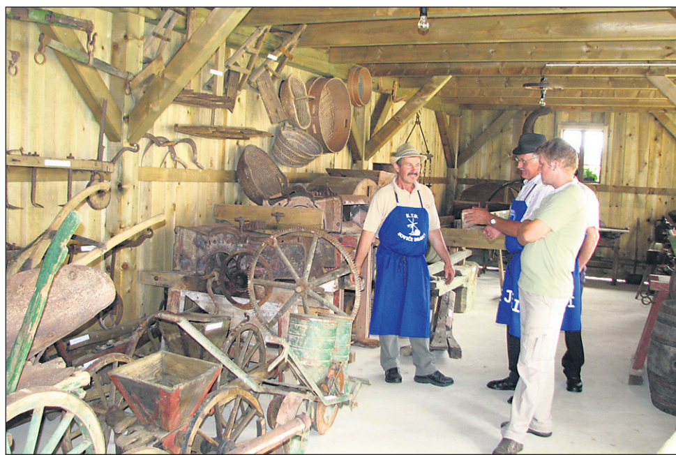
Na kmetiji Korpičevih so prvotno zbirko Od zrna do kruha dopolnili z novo zbirko Od orala do mlatve, za katero so postavili tudi nov lesen skednj.

nar preko kandidature na LAS Haloze, nekaj pa je po razpisu za društva primaknila tudi občina iz proračuna. Vsem res še