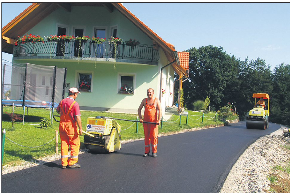
Delavce Cestnega podjetja Ptuj smo v torek ujeli med polaganjem zadnjih metrov asfalta na odseku ceste Hrastovec-Bimarovo-Štok.

Turški Vrh-Cirkulane je veljal 273.700 evrov, za modernizacijo lokalne ceste Borl-Zavrč, odsek Bimarovo, pa so odšteli dobrih 88.000 evrov. Izjemno pomembna pridobitev pa je nova občinska zgradba v Goričaku, ki je skupaj z zunanjo ureditvijo veljala prek 280.000 evrov. Po projektu, ki ga je izdelalo podjetje Ingra - Stanislav Klemenčič iz Gornje Radgone, gre za dvoetažno stavbo s podstrešnim delom, v izmeri 12 x 10 m. V nove prostore se