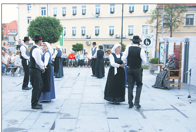
Na prvi Agatin dan se je tudi letos predstavilo KD Delavec.