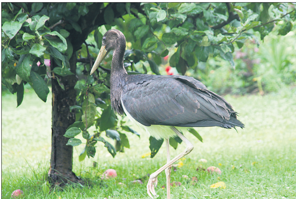
Medtem ko bela štoklja živi v naseljih in v odprti krajini, plaha črna štoklja ne prenese bližine človeka in živi v strnjanih gozdovih, zato je prav zanimivo, da se je ta črna štoklja veselo sprehajala po dvoriščih in vrtovih.