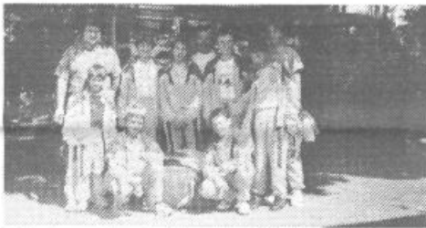
Mlada namiznotenjska ekipa ŠD Podpeč-Preserje

Zgraditi je bilo potrebno nov dimnik. Zgrajena je bila tudi tuš kabina. Potrebno pa bo pred mrazom še toplotno izolirati strop v celem objektu, za kar pa nam manjka sredstev. Radi bi tudi uredili garderobe za igralce. Z ogrevano dvorano smo prišli do prostora, ki je uporaben celo leto, izjemoma tudi za druge namene.