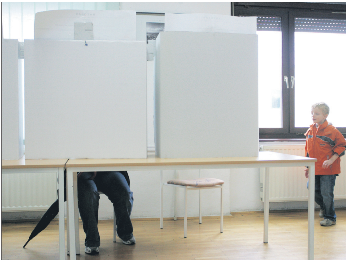
Jeseni nas čakajo lokalne volitve, ko bomo spet izbirali občinske svetnike in župane. O imenih kandidatov se v glavnem še ugiba, nekaj sedanjih županov pa je že priznalo, da se bodo spet potegovali za stolček.