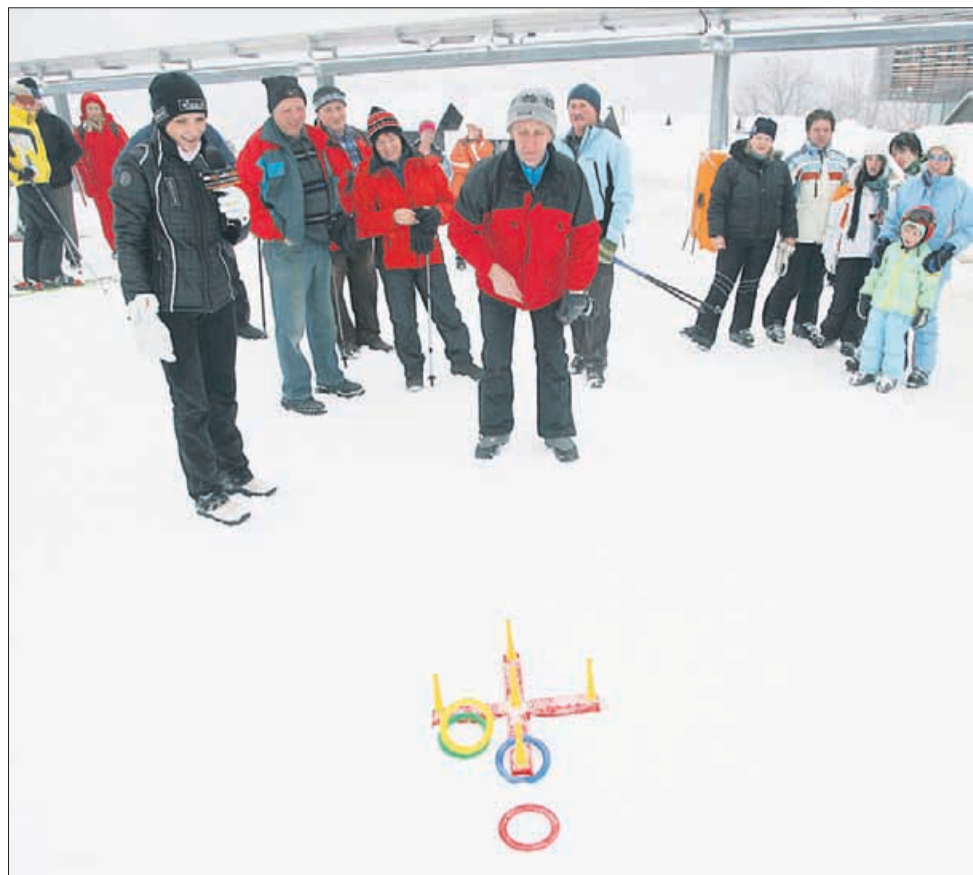
Dajmo! Le obroček mora pristati na pravem mestu in nagrada Pivovarne Laško, Bigg-R in Celjske kočje je vaša!