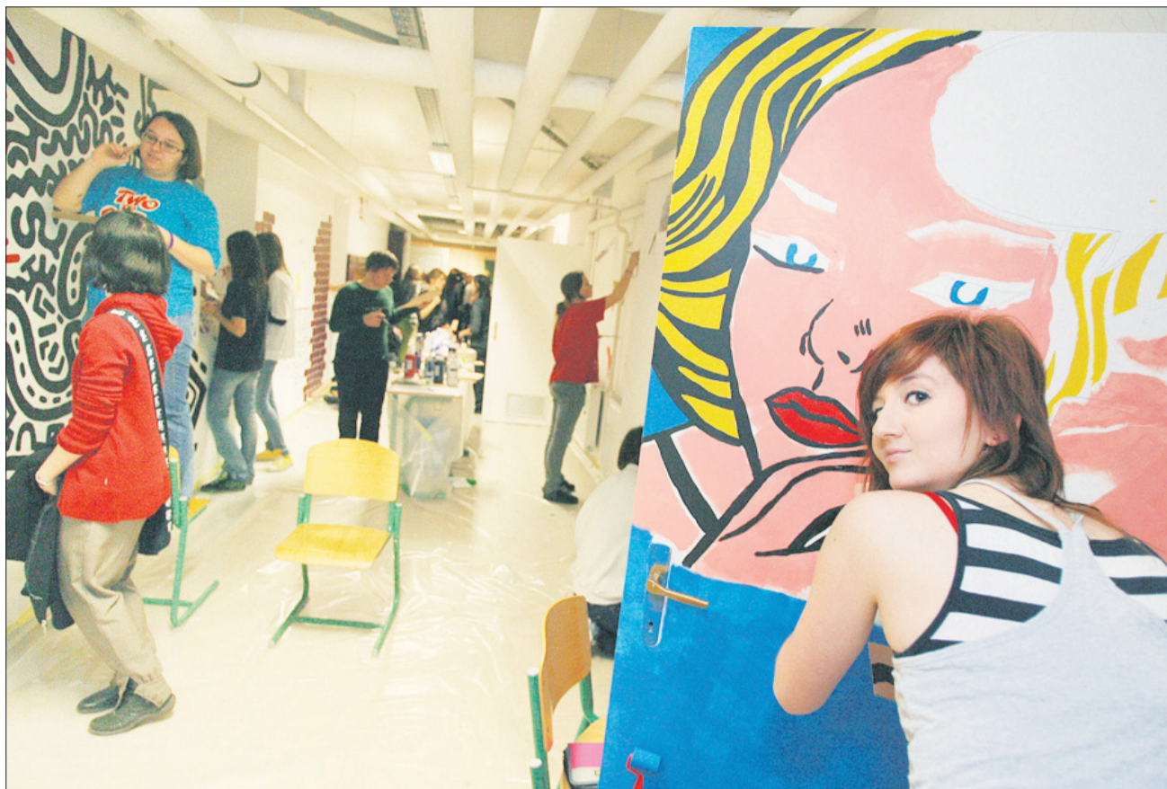
Mladi likovniki so na novo poslikali kletni hodnik ...