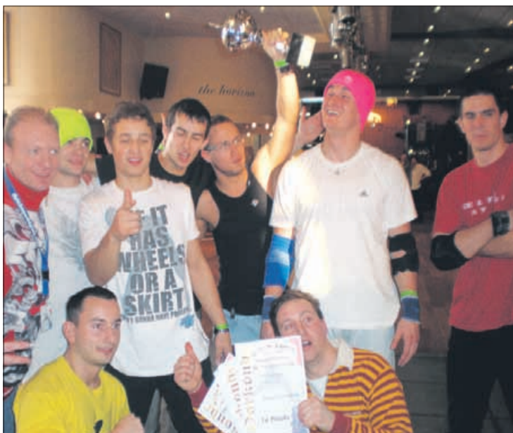
Skupina Cele Attack, ki dosega vedno vidnejše uspehe, se bo predstavila tudi v oddaji Slovenija ima talent.