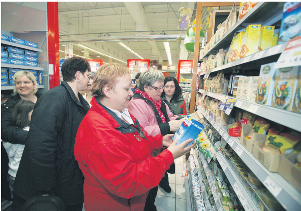
Zdrava živila, z manj maščobami in sladkorji ter manj slana in brez konzervansov, se bodo »hujšarji« učili izbirati med policami celjskega Citycentra.