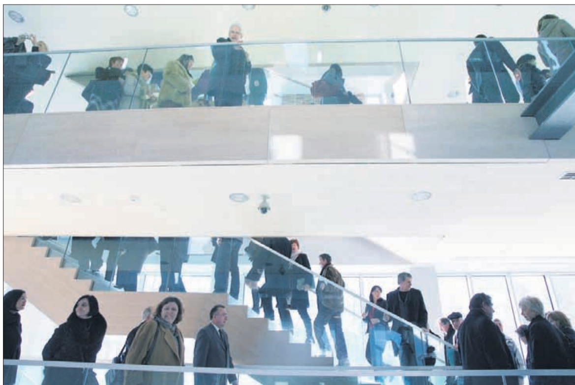
Bralcev, da te kap