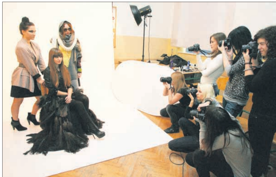
Fotografi so spoznavali tudi modno fotografijo.