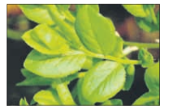
Pri uporabi čaja iz listov borovnice je treba biti previden.

Seveda je še veliko zdravilnih rastlin, ki lahko pridejo do nezaželenih učinkov. Vsak posamezniku se mora pred uporabo poučiti, katera zdravilna rastlina mu res lahko koristi in katera mu lahko povzroči več škode kot koristi. Pri uživanju bodimo vedno zmerni in pripravke iz rastlin uporabljajmo le krajši čas.