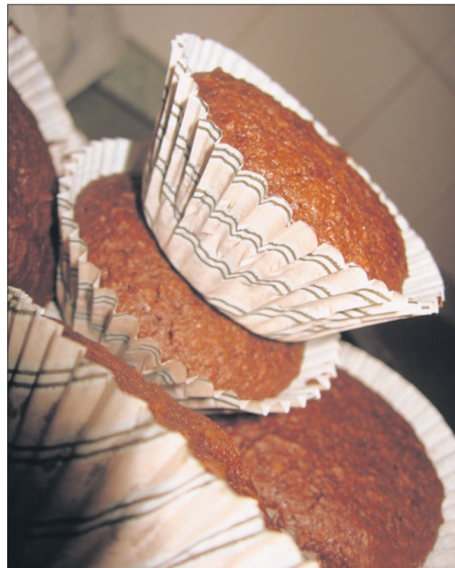
Mafini s presenečenjem? Zakaj pa ne!

Vam draga oseba ni preveč za sladko? Notranji žar lahko prižgete tudi z ostrigami,