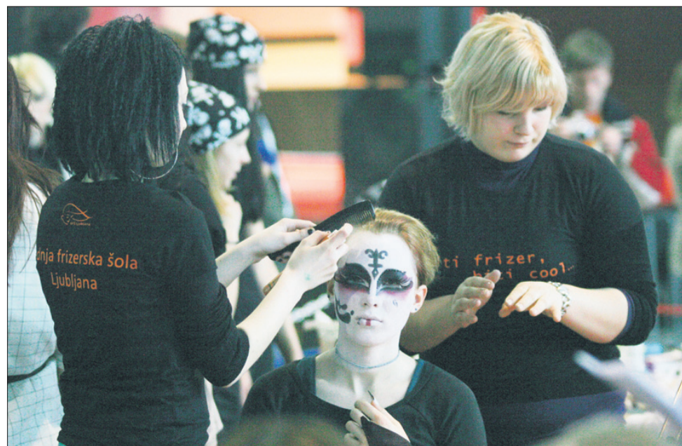
Že veste, kaj bi bili letos za pusta? Mogoče kaj vilinskega, pravljичnega?