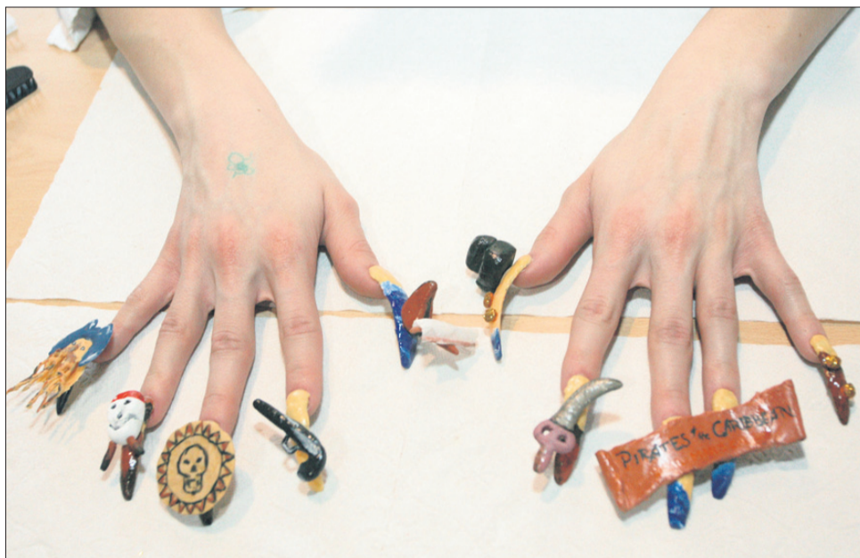
Nekaj filmskih junakov na konicah prstov ...