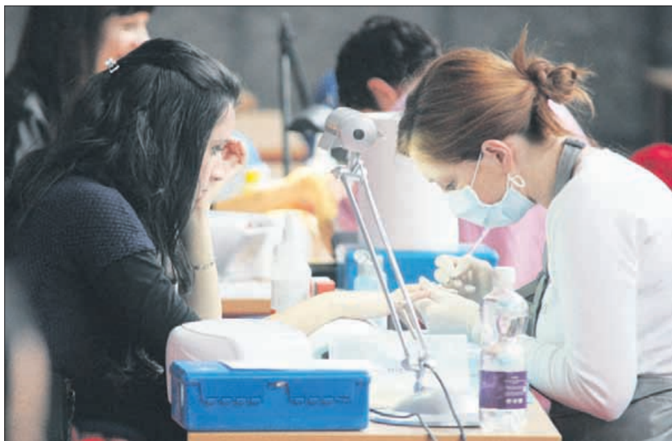
Kemijski poskusi? Ne, le lakiranje nohtov.