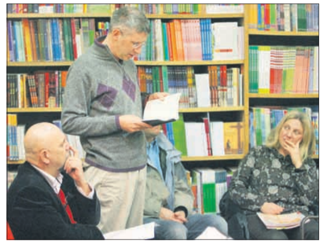
Branje v Antiki