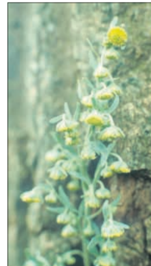
Pelin lahko povzroča nezaželene učinke.

Pravi kolmež ( Acorus calamus ) vsebuje azaron, ki ima izjemno dober pomirjevalni učinek, hkrati pa sumijo, da učinkuje kancerogeno, zato ga jemljemo, kadar je nujno in to le krajši čas (v obliki kure 4-6 tednov po 3 skodelice na dan, nato z uporabo prekinemo). Nosečnice ga ne smejo uživati. Čaja vednozelenega gornika ( Arctostaphylos uva-ursi ) ne pijemo dlje kot 1 teden. Pri bolnikih z občutljivim želodcem in otrocih včasih povzročajo želodčne bolečine in bruhanje. Čaj iz pelina ( Artemisia absinthium ) pijemo le krajši čas. Alkoholni in vinski pelinovi izvlečki, ki so splošno znani v ljudskem zdravilstvu, niso primerni za notranjo uporabo. Pelina ne uživajmo med nosečnostjo in dojenjem. Kdor želi pri obolenjih srca in ožilja uporabljati enovrati glog ( Crataegus monogyna ), naj pred tem opravi kontrolo pri zdravniku specialistu ter hodi na redne kontrole ob daljši