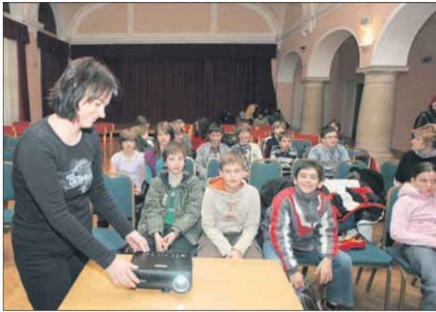
Predstavitev poklicev v kulturi