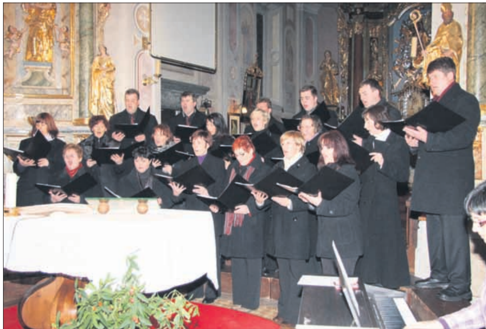
Pevci zbora Marije vnebovzete na jubilejnim koncertu