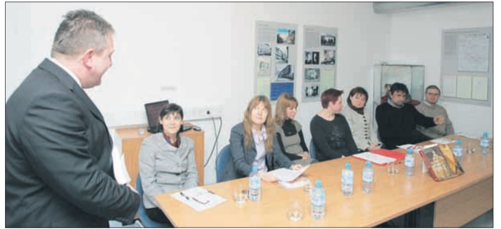
Zgodovinski arhiv je predstavil dve novi knjižni izdaji.