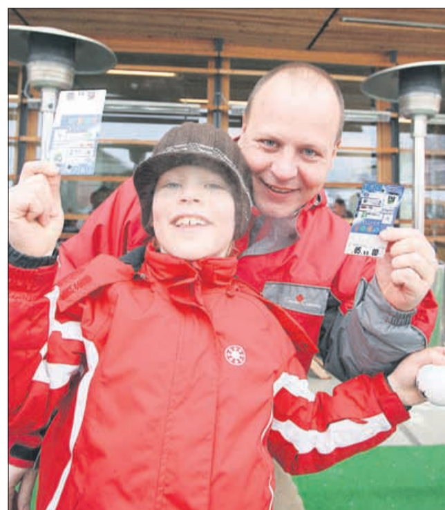
Splačalo se je zabavati z ekipo Novega tednika in Radia Celje. Oče in sin bosta smučala brezplačno!