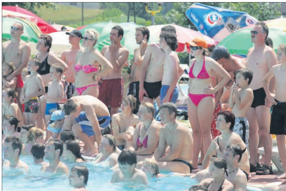
Tudi pri osvežitvi v bazenu velja previdnost. Število obolelih za kožnim rakom se pri nas iz leta v leto povečuje, zato ni priporočljivo izpostavljanje soncu od 11. do 15. ure, priporočajo pa uporabo zaščitnih pokrival, sončnih očal in zaščitnih krem.