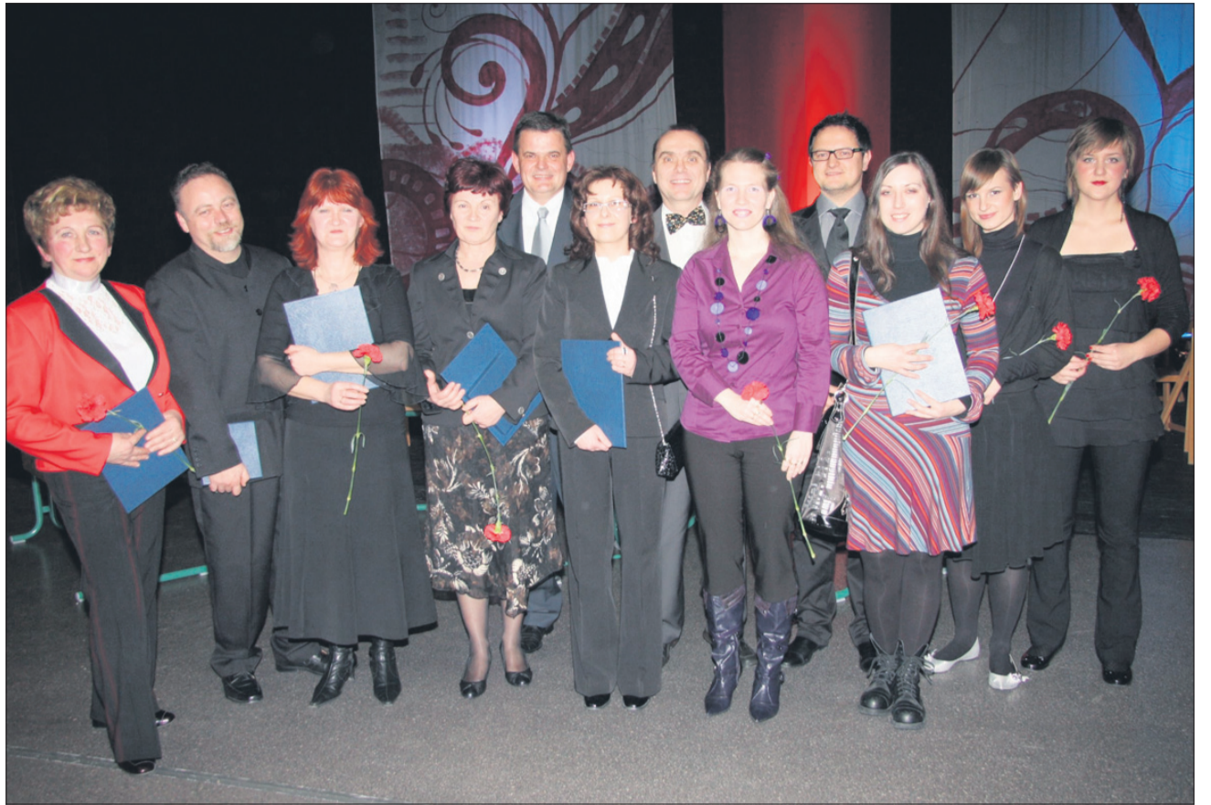
TT V Žalcu so že po tradiciji podelili Savinova odličja.