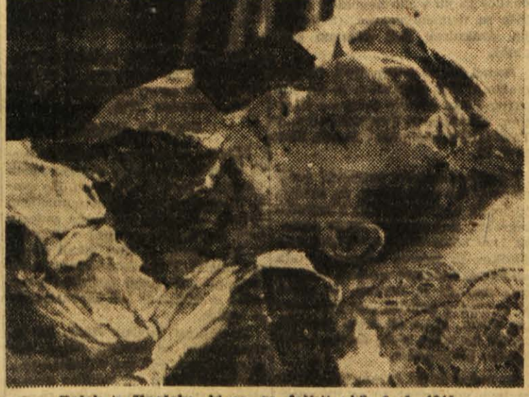
Deček iz Knežaka, ki so ga fašisti ubili 2. 1. 1942.