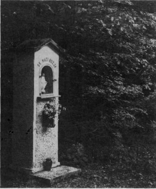
Eno od obnovljenih snežniških znamenj

tudi naključni popotniki srečujejo ob drugem tudi številna zanimiva znamenja, bodisi na odprti cesti ali gozdni stezici, dostikrat tudi na mestih, ki so odmaknjena od ustaljenih planinskih stez. Kultura takih znamenj, sicer z osrednjo versko vsebino, je posebno poglavje v slovenskem ljudskem izročilu. Razlogi za postavljanje takih znamenj so bili vedno zelo različni: bodisi je šlo na takem mestu za nesrečen dogodek, morda nasilno smrt, lahko pa tudi le za duhovni premislek ali priprošnjo, morda za izpolnjeno željo ali srečen izhod iz navidez nerešljivih težav.