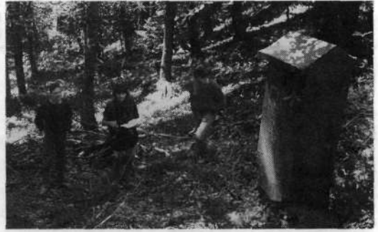
Znamenje Marije Snežne nad Grdo drago pod Snežnikom je že naginjeno in v slabem stanju

Prav ta znamenja so pred skoraj sedemdesetimi leti v snežniških gozdovih postavljali italijanski vojaki in delavci, ki jih je bilo zelo dosti tedaj, ko so utrjevali državno mejo in zaradi nje celo območje. V dobrih desetih letih, od leta 1924 do 1936, so zgradili večino snežniških cest, številne vodovodne rezervoarje, vojašnice v Leskovi dolini, v Moreli, na Mirinu, na Klanski in Čabranski polici, dvoje planinskih domov na Sviščakih (Rifuggio Gabriele d'Annunzio) in Klanski polici (Rifuggio Guido Rey), nato pa so v naslednjih letih zgradili še vse ostale vojaške utrdbe in protiletalsko opazovalnico na Snežniku. Prav v tem času so postavili tudi vsa omenjena znamenja. Naj si jih priključimo pred oči: znamenje na Markovi ravni pod Devinom, znamenje pod Peklom, znamenje Marije Snežne pod Malim Snežni-