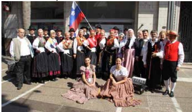
Člani Folklorne skupine Emona v Argentini, 2016

Konec letošnjega januarja je Folklorna skupina Emona, kulturno društvo, začela s polletnim gostovanjem v dvorani šentviškega Ljudskega doma. Četrtna skupnost Šentvid je skupino prijazno sprejela po začetku obnove Osnovne šole Savsko naselje v Četrtni skupnosti Bežigrad. Matična dvorana društva na Belokranjski ulici 6, kjer običajno potekajo vaje, je bila začasno predana v uporabo šolarjem. Člani društva so navdušeni nad pogoji šentviške dvorane za glasbene, plesne in pevske vaje, ki potekajo ob ponedeljkih in četrtek od 19.30 do 21.30. Veliko članov ima zdaj tudi kratko pot do dvorane, saj večina Emoncev živi ali je živelo v ljubljanskih Dravljah, Šiški ali Šentvidu. Začetki Folklorne skupine Emona so namreč povezani s Šentvidom in z bližnjo Šiško.