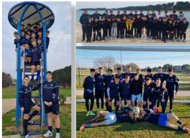
Druženja na igriščih in izven njih.

Utrujeni, a zadovoljni in polni vtisov, so se vrnil domov. Pred njimi so še treningi in prijateljske tekme, nato pa se bo spet začelo »zares«. Pred vrati je namreč spomladanski del nogometnega prvenstva.