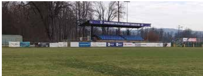
Domače nogometno igrišče

Od 4. do 7. marca 2023 so naše klubske nogometne površine samevale.