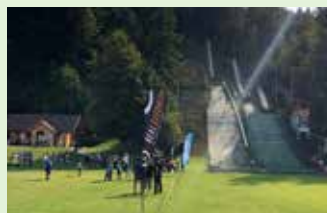
Skakalni center Gunclje