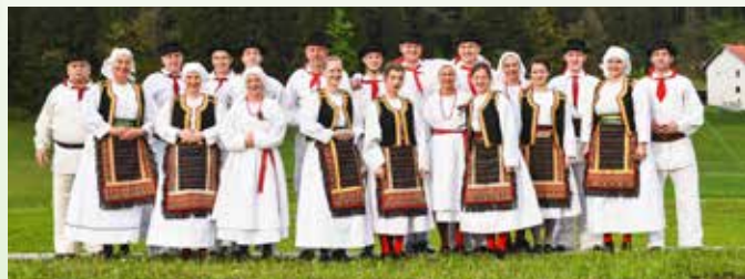
Regijsko srečanje odraslih folklornih skupin, Bloke, 2016

Konec meseca marca skupino čaka volilni zbor članov in nove priložnosti. Društvo se nadeja, da bo po obdobju epidemije COVID-19 ponovno vzpostavilo mladinsko skupino in skupino aktivnih članov. Člani bi z veseljem medse sprejeli glasbenike (harmonikarje, violiniste, klarinetiste ...) in plesalce v starosti od 15 do 40 let. Pripravlja se vpisna akcija, tudi po šentviških šolah, na katerih poučuje kar nekaj Emoncev. Upamo, da bomo še naprej razveseljevali ljudi, s katerimi se nam križajo poti – tudi vas, prebivalce Četrtna skupnosti Šentvid. Vabljeni, da se nam v prihodnje pridružite na nastopih ali vajah.