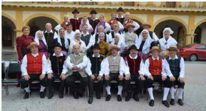
Folklorna skupina Emona v Mehiki, 2014