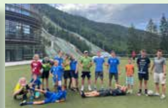
Skupinska slika s poletnih priprav v Planici