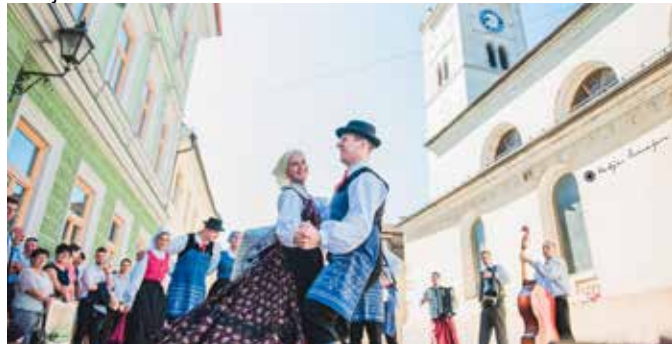
Nastop v Metliki, 2016

festivalov, kjer predstavlja tradicijo slovenskega ljudskega plesa, petja, glasbe in oblačil. Gostovanja v tujini so odlična priložnost za druženje ter spoznavanje ljudi in drugačnih načinov življenja. Kanček slovenskih ljudskih običajev je skupina že predstavila po Evropi, v ZDA, Alžiriji, Argentini, Čilu, Mehiki, Egiptu, na Japonskem in celo v Severni Koreji.