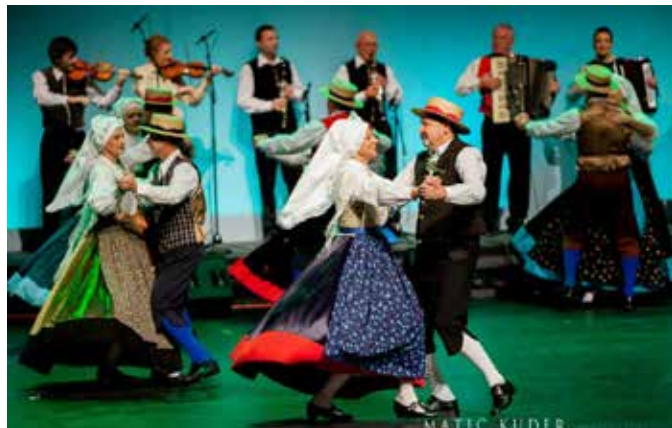
Nastop v Cankarjevem domu, Ljubljana, 2012, Matic Kuder, avtor fotografije

Folklorna skupina Emona je redna gostja domačih in tujih folklornih