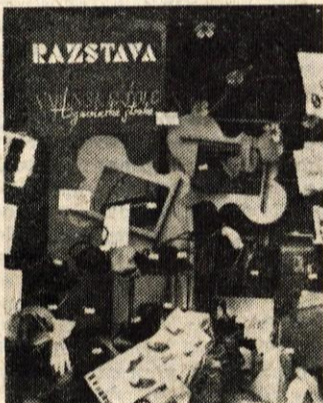
Učenci Vajenske šole za trgovsko stroko Kranj so s svojo razstavo pokazali kaj so se naučili