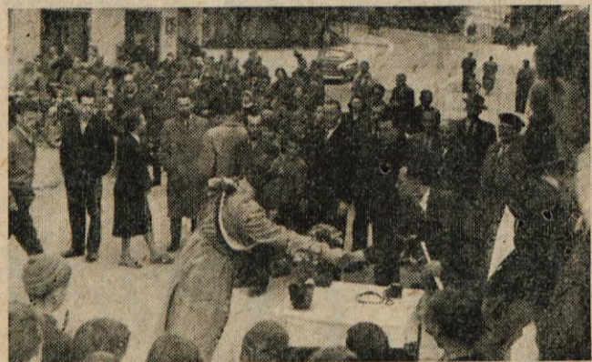
Predaja štafete na Bledu