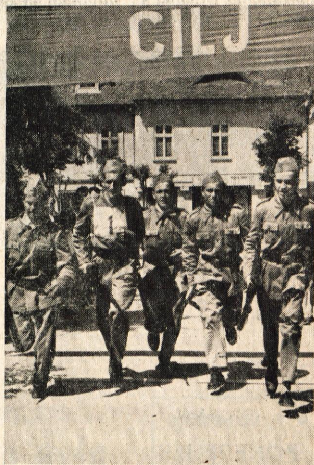
VZGOJITI ISKRENEGA, BORBENEGA IN SOCIALIZMU PREDANEGA MLADINCA JE CILJ PREDVOJASKE VZGOJE

Jesenice zbori volivcev, na katerih tudi volivci razpravljajo o predlogu družbenega plana in proračuna. Na prihodnji seji Občinskega ljudskega odbora, ki bo v ponedeljek 28. maja pa bo Občinski odbor sprejel predlog družbenega plana in predlog proračuna Občin. Ljudskega odbora Jesenice za leto 1956 z vsemi popravki, ki jih bo odbor lahko upošteval. P. U.