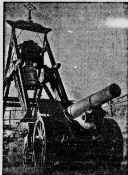
V mestu Rovereto na Italijanskem imajo zvono, ki so ga vili iz topov 17 držav, ki so se vojskovali v svetovni vojni. Vsak večer udarije stokrat na ta zvono, ki naj bi klicale bojevite narode k pameti. Pa se sdi, da je glas njegov — glas vpiljočega v puščavi...

d Pri delu ga je zagrabil tekoči trak. V Kančevi tovarni v Mengšu se je ponesrečil 39-