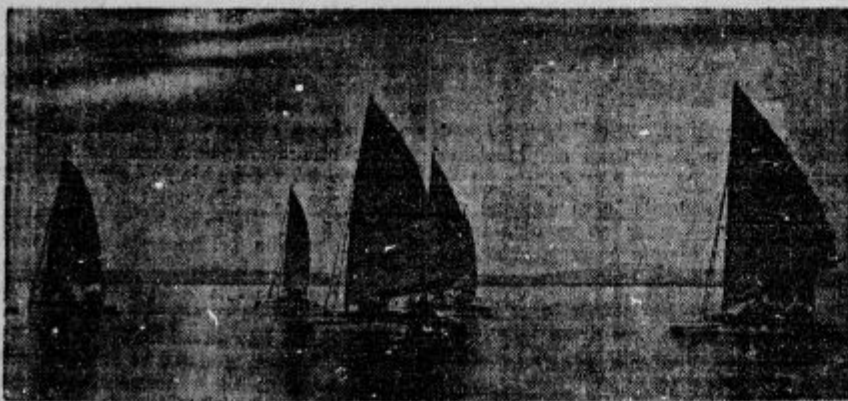
V severnih mrazih krajih imajo poseben šport. K niler zahodne morje, se vozijo po ledu s sanamic na jadra, ki dosežejo veliko hitrost.

d Velika gradbena delavnost v Zagrebu. Gradbena delavnost se v Zagrebu v zadnjih letih stalno veča ter je bilo izdanih gradbenih dovoljenj leta 1934 148, leta 1935 252, lani pa že 394. Ni pa še gradbena delavnost tako velika kakor v letu 1930, ko je bilo izdanih 1836 gradbenih dovoljenj za nove hiše. Pripomniti pa je treba, da so se takrat zidale večinoma le pritrilne hiše, dočim so se letos zidale pretežno samo velike stanovanjske hiše. Tako so bila lani izdana gradbena dovoljenja za 94 novih 3- do 7-nadstropnih hiš, dočim se je takih hiš gradilo leta 1930 samo 89. Za eno in dvonadstropne hiše je bilo izdanih 199 dovoljenj, za 30 več